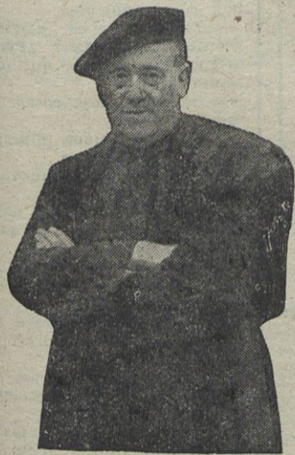
(en la página 8)

UN HOMENAJE A MONSEÑOR ÁNGEL SAGARMINAGA