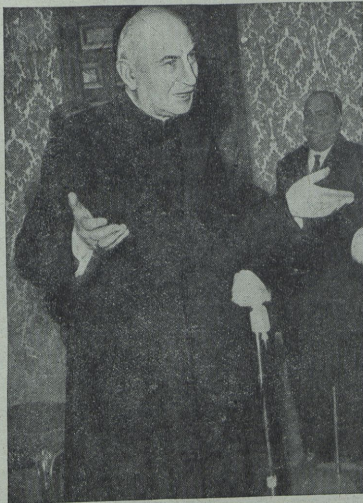
S. E. R. el Prelado de Málaga, Dr. Herrera Oria, director y verdadero impulsor de la importante obra titulada "La palabra de Cristo", declarada obra de estudio en Seminarios y Universidades por el Comité Episcopal Latino Americano

Si el periodista tiene entre sus tareas la de propagar todo aquello que puede tener influencia sobre el público, estamos seguros de que esta noticia que hoy da razón a nuestra entrevista será de interés para todos los católicos españoles al advertir cómo el Episcopado Hispanoamericano ha destacado la aportación fructífera y de hondo valor espiritual que encabeza un santo prelado malagueño, motor de tantas realidades y figura destacadísima de la Iglesia, que no necesita de presentaciones ni biografías.