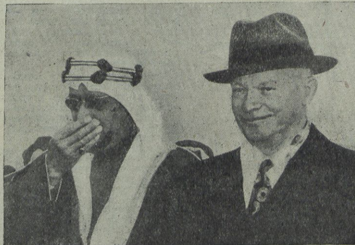
El Monarca árabe, ¿bosteza?, ¿se ríe?, ¿estornuda?, ¿tiene sueño? El extraño gesto recuerda el típico del "insondable misterio del Oriente".

Los indios —de la India— a pesar de las palomas que con cierta periodicidad suelta el Pandit Nehru, siguen coqueteando con los rusos y no hay fiesta o fiestecilla a la que no inviten a un representante de la U. R. S. S. En esta ocasión le ha tocado el turno al mariscal Zukov, que asiste muy complacido, en compañía del vicepresidente Radha Krishnan, a la fiesta de la independencia del país de las castas. Un aniversario muy poco acorde con la idea imperialista del comunismo. La independencia, con su aniversario, la vemos en globo.