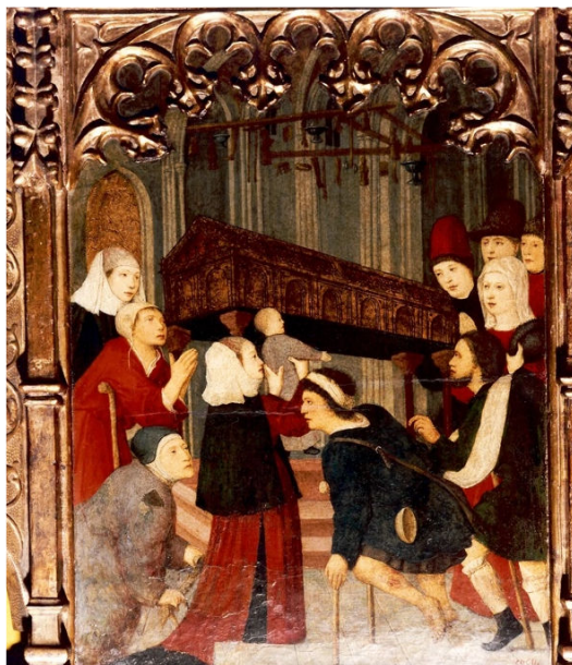
Figura 3. Milagros ante el sepulcro de San Nicolas de Tolentino

Otras de las prácticas habituales era el pasar por debajo del sepulcro o caminar a su alrededor. En el transcurso de la misma se tocaba con las manos el espacio que alberga el cuerpo taumatúrgico, aproximándose a través del vehículo de lo táctil al contacto con la figura sagrada, de manera que el tacto suscitaba emociones que se complementan y suplementan con lo ocular. Para el teólogo escolástico Roger Bacon (1214-1294) "la carne percibe a través del tacto, como el ojo a través de la visión" 16 , ambos sentidos en realidad se encontraban muy próximos en la cultura visual medieval a partir de la teoría de la extramisión , donde el tacto se asimiló a la vista 17 . De ahí que observar cumplía una función similar al roce con las reliquias o sepulcros santos conectando el ojo y la mano, espíritu y carne, ya que "ver es tocar pero a distancia, lo que no impide, sin embargo, que el vehículo creado por la vista fuerce la proximidad, anulando la lejanía" 18 .