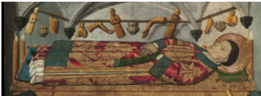
Figura 5.: Representación del yacente y exvotos en el sepulcro de San Vicente Mártir.

Ya retornando nuevamente al retablo del sepulcro de San Vicente Mártir, como ejemplo se deben tener en cuenta algunos detalles para su correcta interpretación dentro de su contexto y su función. Primeramente, la relevancia que poseerá este santo dentro de la corona de Aragón junto con San Lorenzo y Esteban, lo que justificará las advocaciones reiteradas a su nombre, como también las referencias taumatúrgicas en los retablos locales incluidas en el marco político y geográfico de dicha corona. Sabiendo que la representación corpórea del sepulcro incluía un valor simbólico agregado, no es de extrañar que "el desarrollo de efigies yacentes en el arte funerario permitía asociar de manera mucho más intensa la representación del santo a la fisticidad de sus restos" 21 , lo que daba lugar a una aproximación visual más figurativa en la mente del fiel sobre el santo. En este caso, se recrea como un sepulcro dorado elevado y sustentado sobre columnas similares a los observados anteriormente. En el caso de San Vicente cuenta con elementos geométricos y posiblemente vegetales casi desdibujados. En un segundo nivel, la representación de la figura escultórica yacente del santo, con nimbo y una túnica aterciopelada donde destacan los colores rojos y dorados, su rostro posee un acabado entre lo naturalista e idealista referencial en la forma de definir los rasgos de santos del reconocido taller que lo realizó 22 .