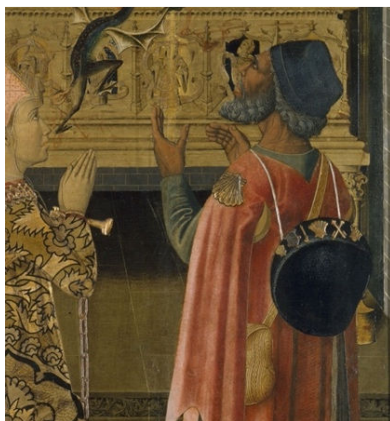
Figura 9. Peregrino frente al sepulcro de San Esteban