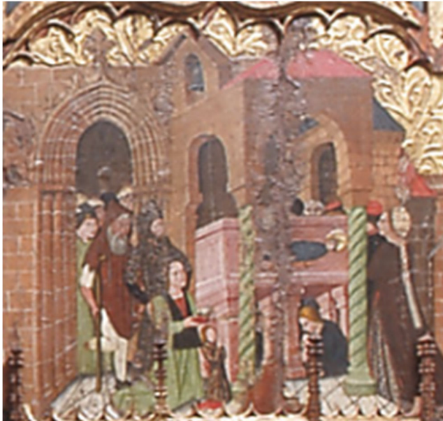
Figura 2. Tabla que recrea el espacio funerario de San Lorenzo en Preixana (Lérida)

En estas tablas se busca captar en un solo momento los actos de devoción y contacto diarios de los creyentes en los espacios funerarios de los santos. Es habitual encontrar recreaciones pictóricas donde se observan a los devotos dialogando delante del sarcófago sobre sus milagros, implorando ayuda, arrodillándose delante del santo, tocándolo, o simplemente contemplando en silencio. Todos ellos se atestiguan figurativamente en la tabla de los milagros en Sarrià. A estas prácticas representadas en dicho retablo se pueden agregar