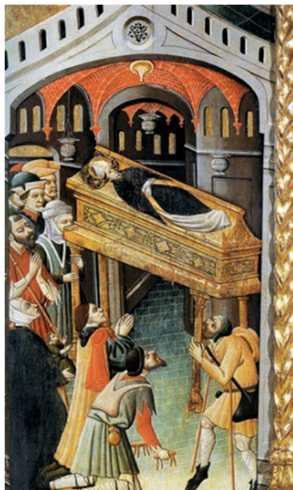
Figura 4. Sepulcro de Santo Tomás de Canterbury en el retablo de Anento (Huesca)

Tanto el roce con los labios y con las manos, como la invocación al nombre del santo, quedan registrados en una de las tablas del Retablo de Anento (Huesca), en el que se contempla el sepulcro de santo Tomás de Canterbury elevado y un grupo de fieles. A medida que van ingresando al espacio funerario se ubican a su alrededor para venerar sus restos. Algunos caminan por debajo y a sus lados, acariciando los objetos cargados de su potentia , como son las columnas o el sarcófago, generando un contacto visual y háptico. Tal sucede en el caso del fiel representado en primer plano que ruega, toca y besa la columna posiblemente para recuperar o alcanzar un buen andar. Ocurre lo mismo con la creyente ubicada detrás del yacente que posa sus labios con fe en el sarcófago y toma con sus dos manos la columna. Es la gestualidad la guía afec-