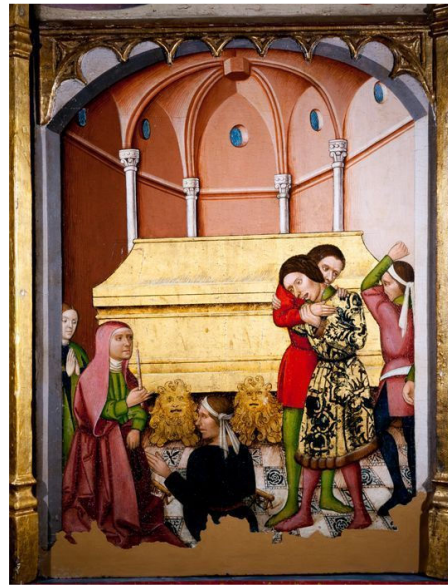
Figura 8. Tabla paralela al encarcelamiento que muestra el lamento ante el sepulcro de la santa

Por otra parte, la inclusión en las representaciones de incensarios sobre los sepulcros que aparecen en varios de los retablos investigados demuestra cómo los aromas cumplían un papel fundamental en la atmósfera santa. A partir del siglo XII-XIII las propias fragancias eran una forma intangible de representar la virtus del santo 41 , cumpliendo a través de la impregnación una función de comunicación entre Dios, los santos y los hombres sin mediar palabras 42 . No solo se diferenciaba un espacio sagrado de uno profano al distinguirse los aromas cuando se ingresaba en el recinto sagrado, sino que además incluía una importante carga simbólica, ya que tanto la cera como el aroma a flores, tragacanto, bálsamo, láudano, el cinamomo, nardo o mirra quemada 43 evocaban la presencia de los santos 44 .