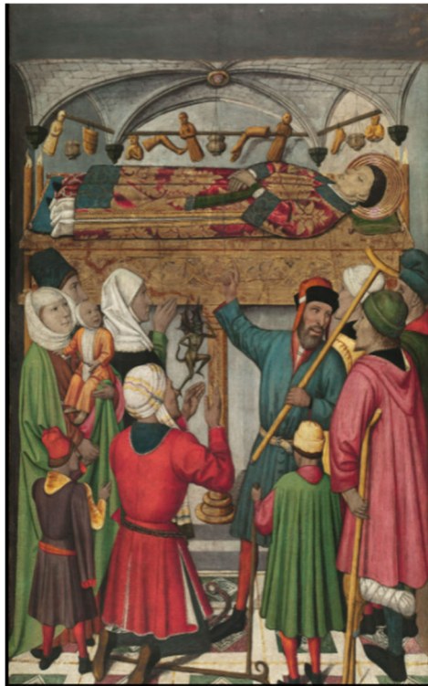
Figura 1. Tabla de los Milagros ante la Tumba de San Vicente Mártir en Sarrià.

Lo que se intenta demostrar es la variedad de milagros que podía realizar el santo, siendo los pobres y enfermos los protagonistas en esta obra, a pesar de que tras el análisis de las vestimentas se haya corroborado que sus indumentarias eran propias de la moda de su época 10 y que no hacen referencia