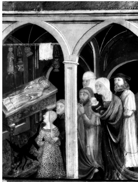
Figura 6. Sepulcro de San Esteban en el retablo de Castellar del Vallès

La ritualidad en torno al santo sumaba asimismo otros factores de la experiencia que involucraban todos los sentidos posibles para generar una atmósfera sagrada. Algunos de ellos quedaron registrados en este tipo de imágenes como son los cirios, los incensarios y las lámparas de aceite que se colocaban encima o a los costados del santo. Los cirios, que también podían ser ofrendas votivas, no solo iluminaban el lugar generando un juego de claros y oscuros en el espacio funerario del santo, además sumaba una cualidad propia de la organicidad de su materia, y es que el hecho que fuesen de cera al fundirse evocaba lágrimas "reforzando el efecto penitencial de las ofrendas votivas hechas con dicho material" 37 . Su valor simbólico de fe y promesa del fiel se encontraba tanto