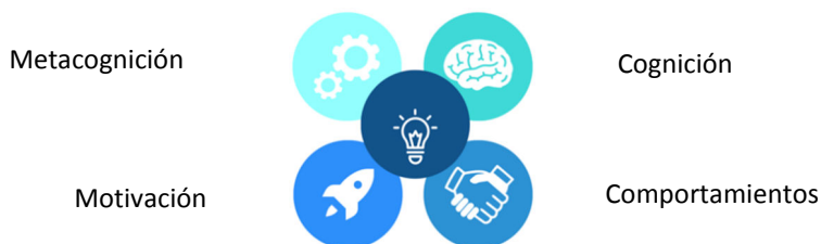
Figura 2. Las Cuatro Dimensiones de la Inteligencia Cultural

Fuente: La figura representa las cuatro dimensiones de la inteligencia cultural propuestas por Earley y Ang (2003) 27 .