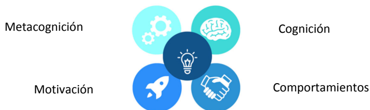
Figura 2. Las Cuatro Dimensiones de la Inteligencia Cultural