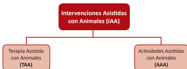
Tabla 4: Clasificación de categorías de las IAA según cita Senent.

Como se puede comprobar, existen numerosos términos que definen la IAA, y en todos ellos hay un nexo común, la presencia de un animal domesticado. La IAA consiste en la presencia exclusiva de animales en ámbitos de intervención terapéuticos, sociales, educativos, lúdicos, entre otros, como participantes del cambio. Es decir, el animal forma parte integral de un programa que está dirigido y evaluado por un profesional del ámbito de la salud o de la educación, donde se busca la consecución de unos objetivos específicos de índole sanitario o educacional. El profesional que trabaja en cualquiera de estos ámbitos ayuda a educar y a motivar a los usuarios del programa con el fin de que se alcancen los objetivos propuestos en valores, habilidades, actitudes y conocimientos necesarios (Peña, 2015).