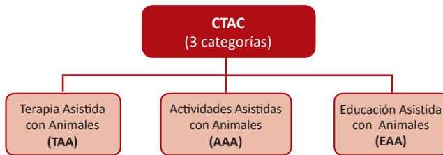
Tabla 3: Clasificación de categorías de las Intervenciones con animales en España (Martos Montes et al., 2015).

Otros autores como Martos Montes et al. (2015) definen las IAA como “aquellas en la que el animal forma parte integral de un programa y está dirigido, desarrollado y evaluado por un profesional de la salud o de la educación, buscando objetivos específicos de índole médico o educacional”. A su vez, Peña (2015) afirma que deben de estar diseñadas para promover mejoras en el funcionamiento físico, social, educacional, emocional y/o cognitivo de una persona, contando con objetivos específicos para cada individuo, donde el profesional especializado ayuda a motivar y a educar a las personas destinatarias del programa en aquellas actitudes, habilidades, valores y conocimientos necesarios, con el fin de alcanzar los objetivos propuestos.