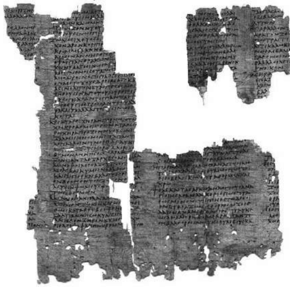
P. Heidelberg, Inv. G 1701, recto .