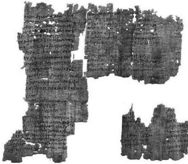
P. Heidelberg, Inv. G 1701, verso .