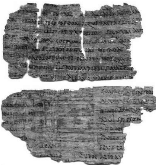
P.Heid. inv. L 1.