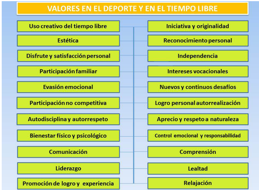
Figura 2: Valores del deporte recreativo y del tiempo libre

Fuente: Frost y Sims (1974) en Ruíz y Cabrera (2004)