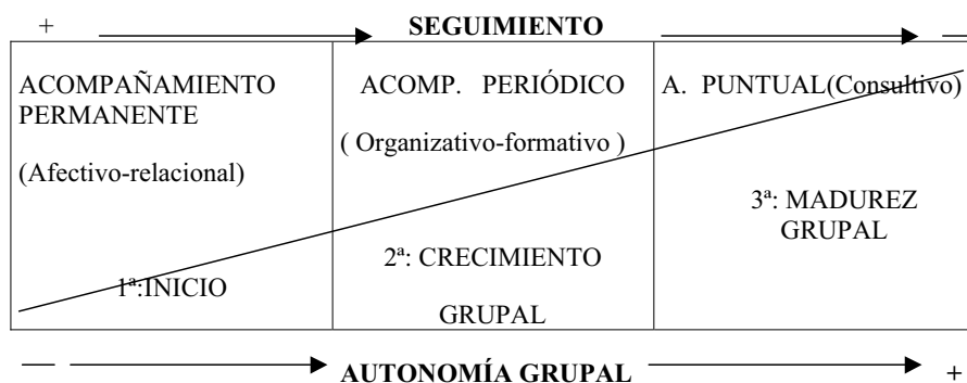
GRÁFICO 1. Seguimiento grupal