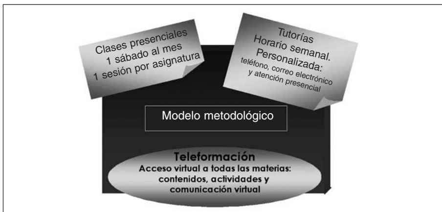
Modelo metodológico (Elaboración propia)

co 2005-2006 ha sido de 10 en la franja horaria de 8 a 15 horas. La primera sesión presencial fue el sábado 8 de octubre de 2005.