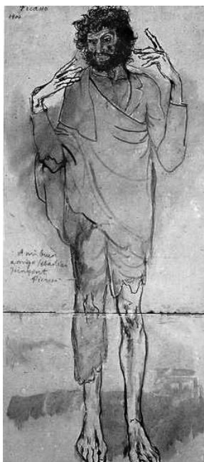
Fig. 1. Pablo Picasso. El Loco (1904). Museo Picasso. Barcelona.

A continuación presentamos algunas manifestaciones plásticas de artistas que han representado en sus lienzos la locura, los locos y los enfermos mentales y han descrito la expresión de la enajenación y los lugares que los acogían.