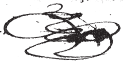
Lámina I: BUS, Salm. 2752, f. 3.

Εμψι μιν προτων αγων χοριων καλαθυμιον ηρ. του μαρζου δαδ εμπαρτασιν ην προσησαν εσηδη και της εουσεβιας δι τωσ εικμοι και ασοι και γαρ σηλικα διαβερωντα ταυτα προσεχθη εσωδαλασιν απαντες ομηρικα και τον ασκητικον αυτα ζομενοι βιον ρυκλωσ ταυτα και μελημεσαν δια της κωλικ προσεφεροσι και τον τον ετων εμρωτων αρ. και τα του σωματος καλυναροντα παδη. η γαρ ηδωρη τα μελωδια τα εφεχθη και δια χαρφη κηρασσα. τρισηδαλουε και αξιερασον τοις αροτις διδασκαλιαν προκιδωκεν και γαρ ιδου. των μεν αγων δρων σε γραφων. η ουδαριωσ. η ολιγα των απων μεμενημερουε τουε πηχτουε. των δε πριπων του διου δαδ αγουματων. ποχηουε ποχηαιε και ταυτ ομωθη και ταυτ γραμματα και ταυτ οδοι απομενημενουε και ταυτ του μερουε αρματιαε. σφωρ ανλουε καβαδεχροντα και δια ταυτα της διμηδιαε καρτωμενουε ην σφεχλιασ. δια ταυτα μεν οσο χριστην μεν εβουλομεν ερμηνωσασιν ταυτων ην προ κεισιν