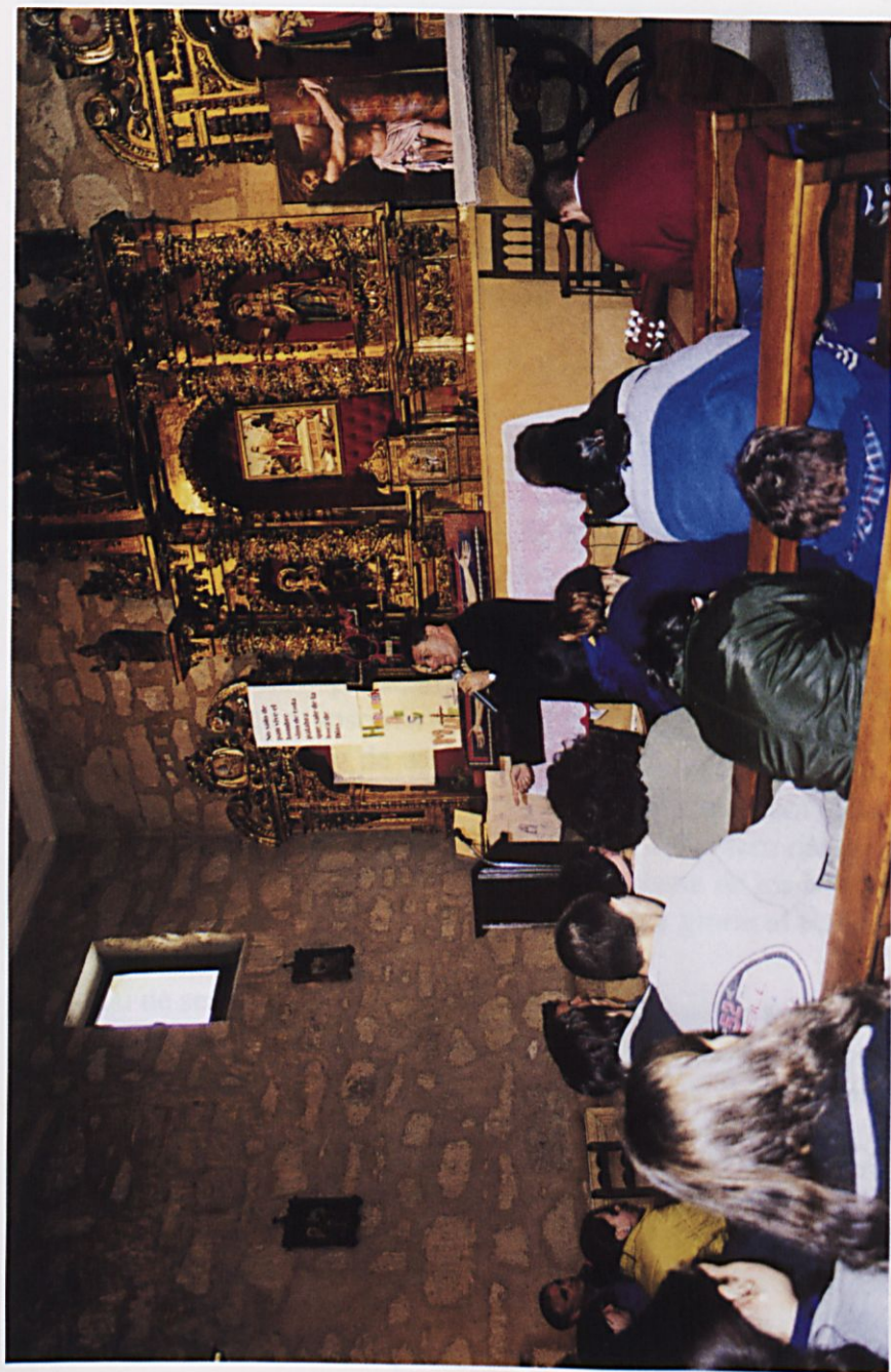
Encuentro de jóvenes del Arciprestazgo de Sancti-Spiritus, en la parroquia de Cabrerizos, con motivo de la visita pastoral. (7-abril-2001)