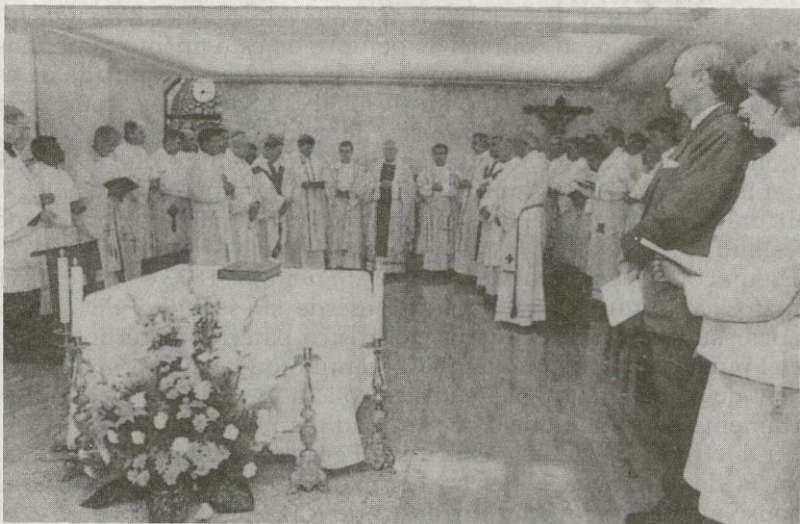
El Cardenal Arzobispo de Glasgow, el Nuncio de S.S. Mons. Lajos Kada, D. Braulio, Obispo de Salamanca, demás obispos escoceses y sacerdotes de Escocia y Salamanca en la solemne concelebración. Sres. Embajadores del Reino Unido en España.

El Real Colegio de los Escoceses tiene previsto organizar diferentes actividades con motivo de la inauguración de las nuevas dependencias.