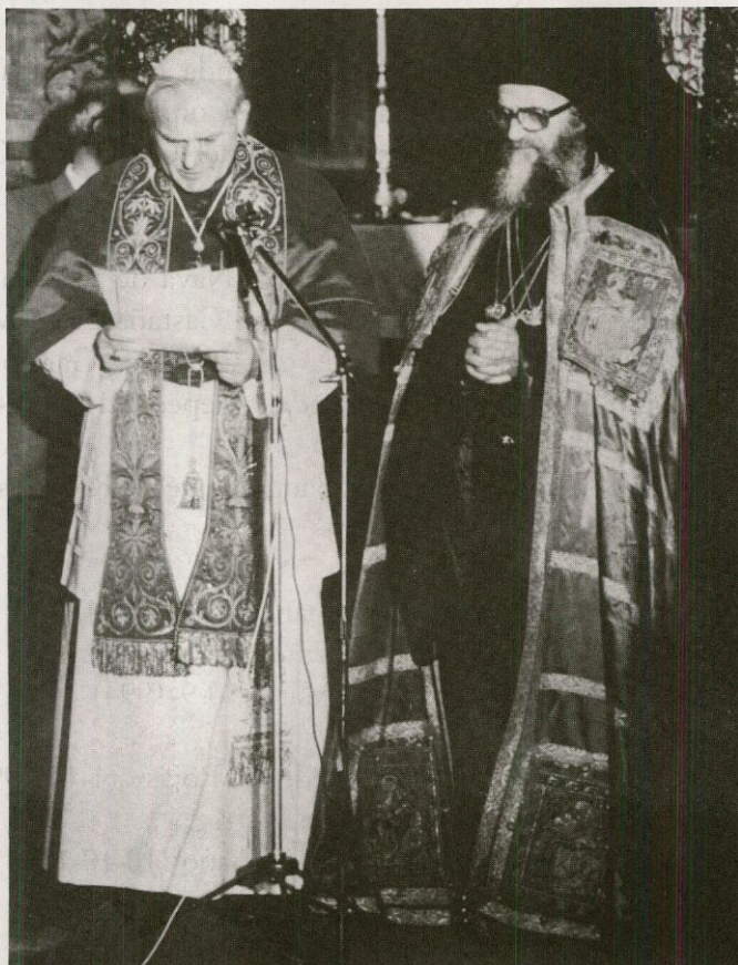
Juan Pablo II con el Patriarca Dimitros I