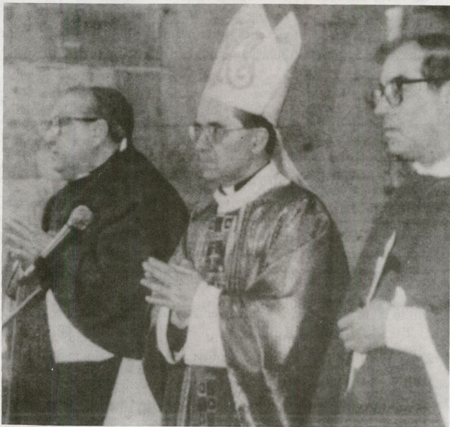
Monseñor Tagliaferri, Nuncio del Papa en Madrid, presidió la Eucaristía, en la Iglesia de San Esteban, el 20 de marzo, con ocasión del 50 aniversario de la Hermandad Dominicana. A su derecha, Don Mauro nuestro Obispo. Más de 1.500 salmantinos asistieron