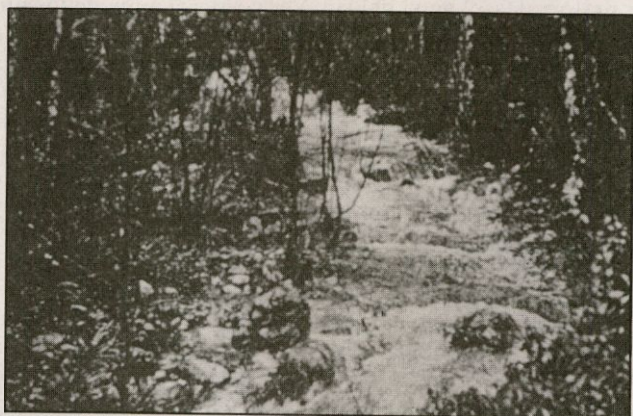
Río Batuecas, de cristalinas y musicales aguas

Ruido de campanas en la espadaña. Noche y día las campanas repican los mismos sones que hace siglos ensayaron los frailes ermitaños convocando a la oración. La campana grande —¡talán, talán, talán!— y la pequeña —¡tilín, tilín, tilín!—, la campana claustral, de más alegre son. El repique de campanas llena el angosto valle; no convoca a nadie fuera del monasterio, sólo recuerda a los frailes y a los animales del bosque que ha llegado la hora de la plegaria, de la canción de amor entonada al Creador.