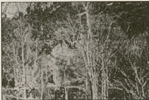
Exuberante naturaleza agreste en el recinto del desierto de Batuecas

En realidad el carisma teresiano es muy amplio y abraza todas las actividades. Todo puede ser específico , aunque algunas pueden ser preferenciales . Por ejemplo, los desiertos carmelitanos pertenecen a la esencia del carisma, a la entraña de la orden, pero son una modalidad extrema . El carmelita no es necesariamente un ermitaño, pero puede serlo temporalmente, de modo coyuntural, para realizar mejor después sus actividades cotidianas: misionar, escribir, enseñar, pastorear, etc. El desierto es una institución muy original dentro de la vida del Carmelo, una orden mendicante, promovida por el P. Tomás de Jesús, hombre polivalente, que también impulsó el movimiento misionero de la reforma y escribió libros admirables de teología mística, de espiritualidad.