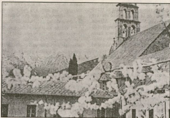
Batuecas, en la impresionante cadena de las montañas hurdanas

En Batuecas, glorioso desierto carmelitano, sepultado en las serranías de la Peña de Francia, donde se besan las provincias de Salamanca y Cáceres, en el corazón de Las Hurdes, se inició la vida eremítica en 1599 con una treintena de carmelitas descalzos. Una cerca de seis kilómetros abraza un estrecho valle y altas crestas. Austeridad extrema, soledad y silencio casi absoluto, ayunos frecuentes, oración casi continua noche y día constituyen la vida cotidiana. Después de la desamortización, las grandiosas instalaciones fueron derruyéndose y el bosque incendiado. Las carmelitas descalzas del Cerro de los Angeles (Madrid) lo recuperaron para la Orden, y después de un tiempo de estancia en él (1939-1950), se lo cedieron a los padres carmelitas de Castilla quienes instauraron la vida eremítica a partir de 1950. A estas soledades acudo año tras año buscando el silencio y la soledad. Las dos semanas escasas de permanencia de este año las he dedicado a ver, sentir, escuchar y vivir Batuecas .