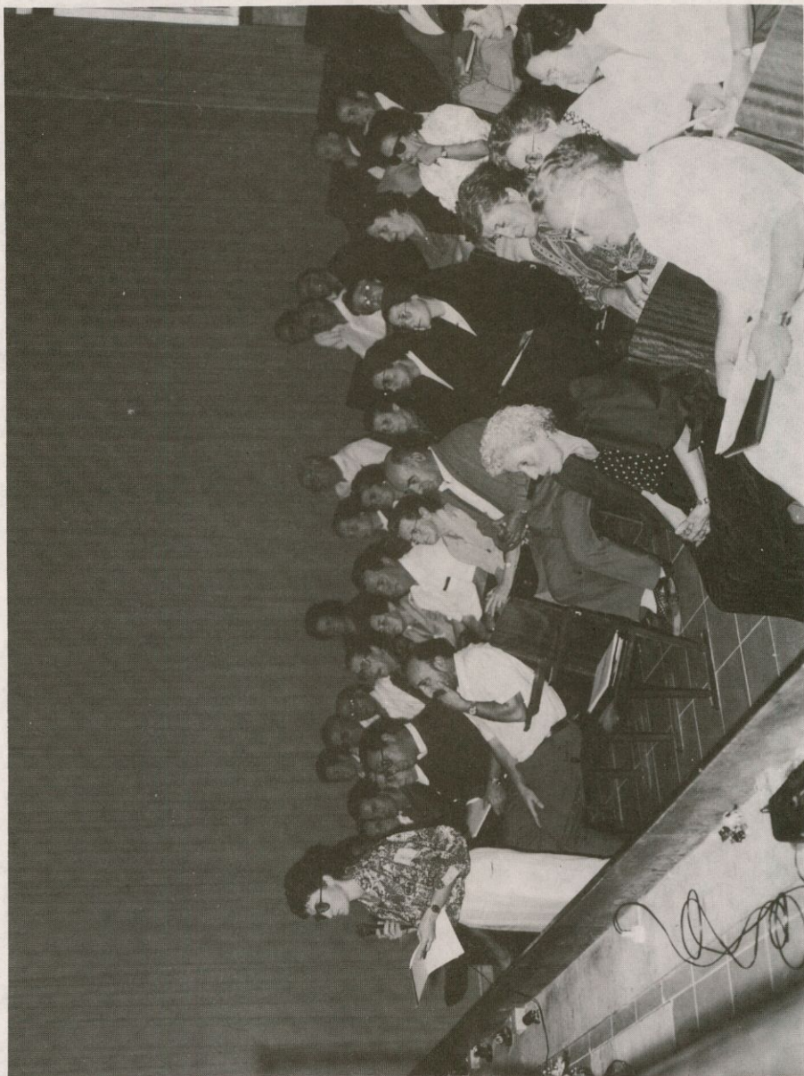
Grupo de asistentes a la Asamblea Diocesana de Pastoral Rural en el Salón de actos del Seminario de Calatrava