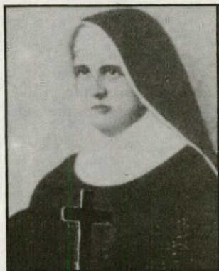
Madre Josefina Bannini 1859-1991