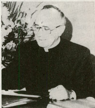
Excmo. y Rvdmo. Señor Don Ciriaco Benavente Mateos, nuevo obispo de la diócesis de Coria-Cáceres

Don Ciriaco Benavente Mateos nació el 3 de enero de 1943 en Malpartida de Plasencia (Cáceres). Fue ordenado sacerdote en Plasencia el 4 de julio de 1966.