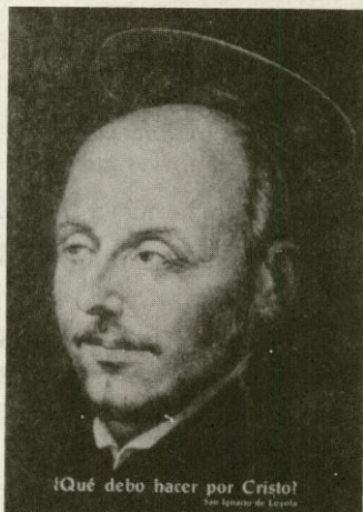
San Ignacio de Loyola (1491-1556)