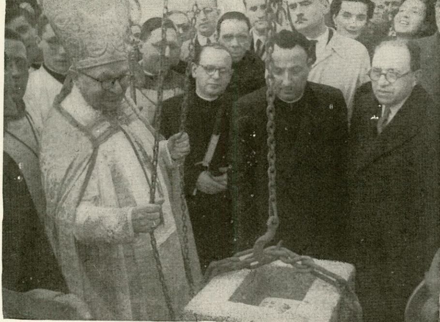
Bendición de la primera piedra del Seminario de Linares