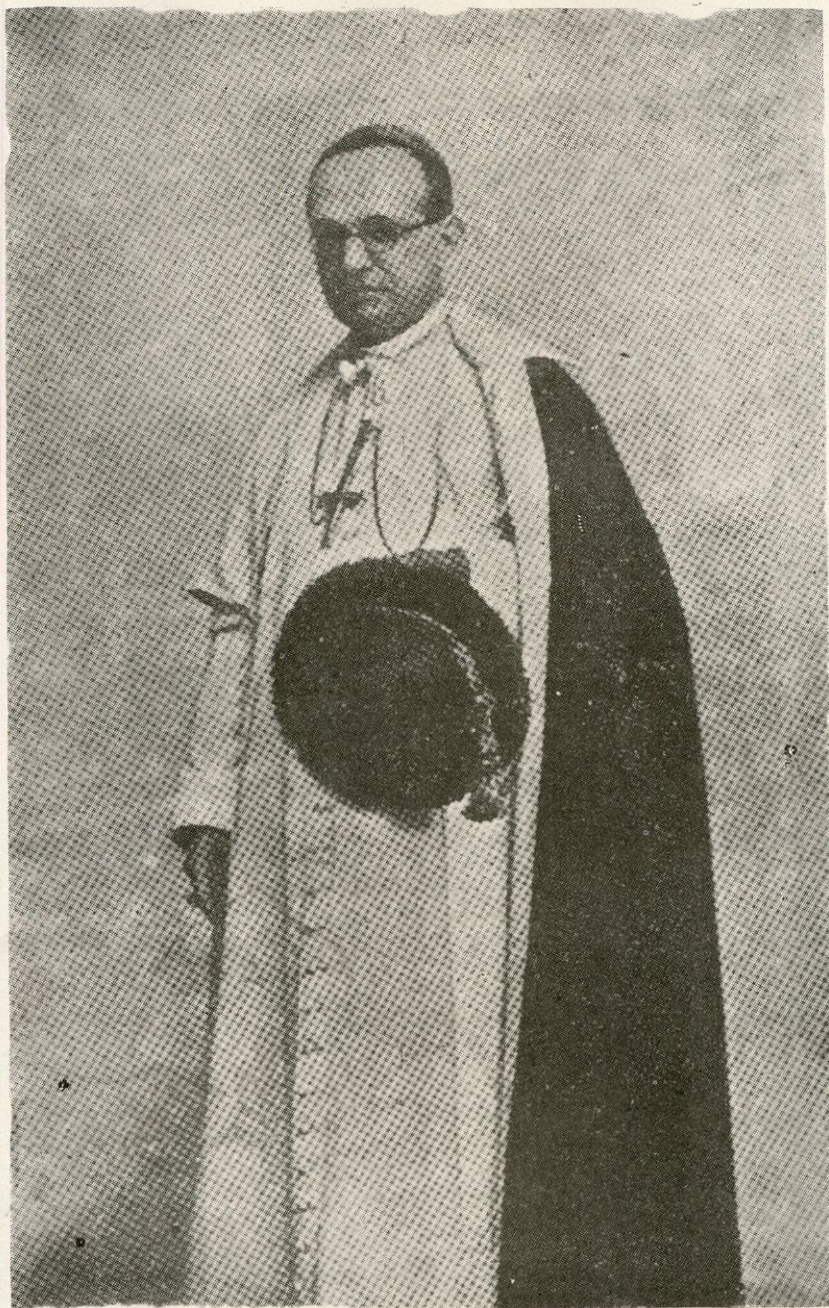
Primera fotografía como Obispo, publicada en la prensa en 1935