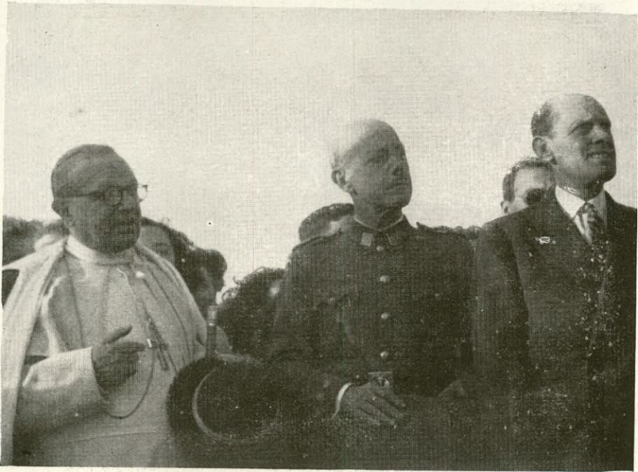
Las autoridades salmantinas: Obispo, Presidente de la Diputación y Gobernador Militar reciben en el límite de la Diócesis a la Virgen de Fátima

ción reflejada en su rostro y en sus ojos, estaba allí al frente de sus hijos, para recibir a la Virgen Peregrina. De 60.000 a 70.000 almas se pueden calcular las que, entre cánticos y aclamaciones, recibieron a la Virgen de Fátima. En torno a Ella, y en el magnífico cuadro de la Plaza Mayor, estuvo Salamanca entera entonando, con lágrimas en los ojos, una fervorosa Salve. El amplio Templo de la Purísima fue materialmente incapaz de albergar durante la noche, a los devotos que forcejeaban por pasar la noche en oración ante la Santa Imagen. La palabra paternal del Prelado enfervoriza una vez más a su pueblo. Tres días estuvo la Virgen entre nosotros, y bien podemos asegurar