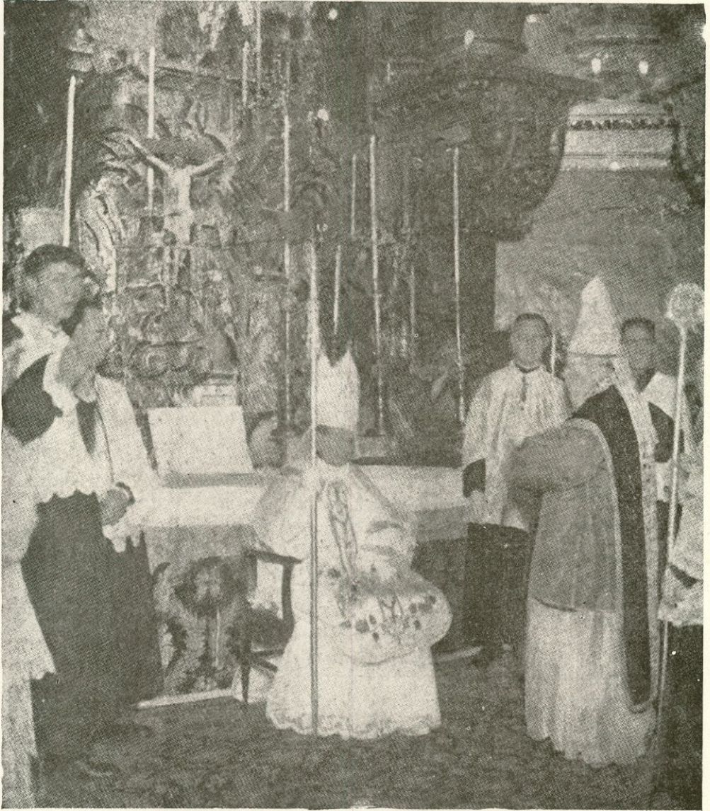
Entronización del nuevo Obispo