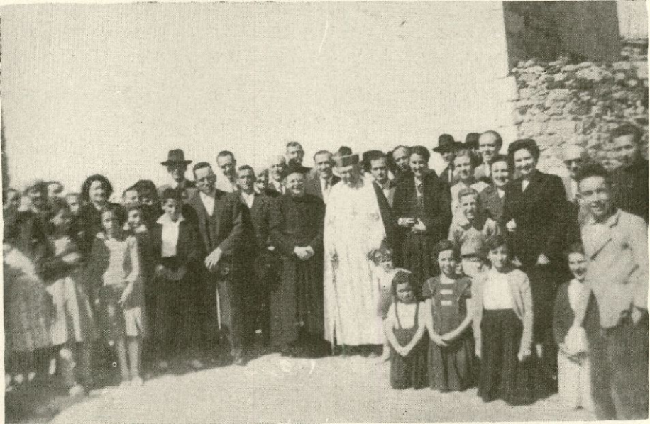
Visita Pastoral a Los Santos (2-junio-55)

El Rvdmo. Prelado conoce todas las Parroquias de la Diócesis, las que ha visitado dos, tres o más veces mediante la Santa Visita Pastoral u otras ocasiones que se han pre-