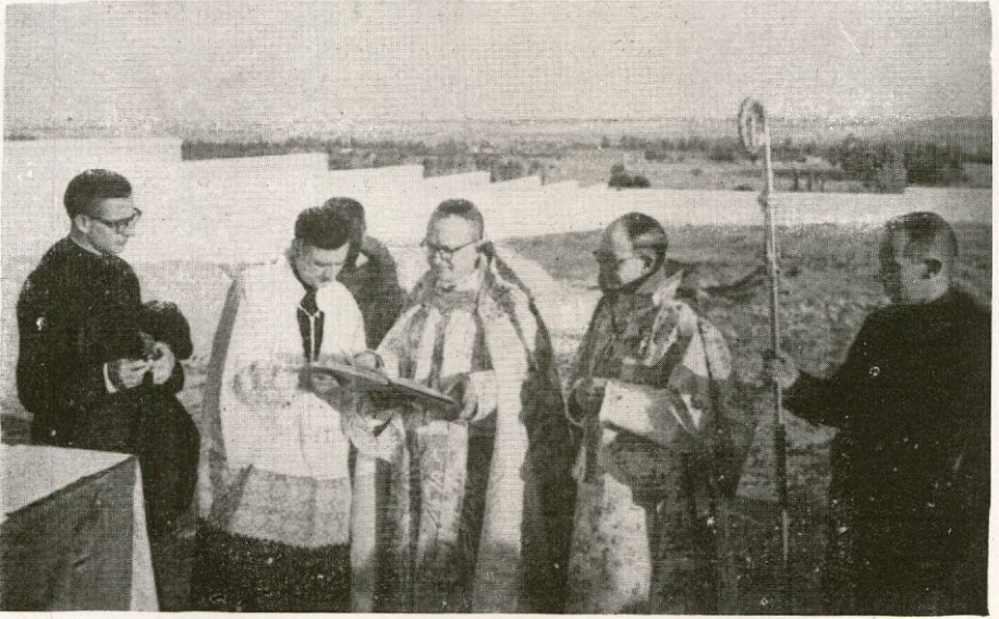
Bendición de la 1.ª piedra de la Casa «Ntra. Sra. de la Vega» Salamanca

mentos estos sus deseos y más clara aún la urgente necesidad de la Casa Diocesana.