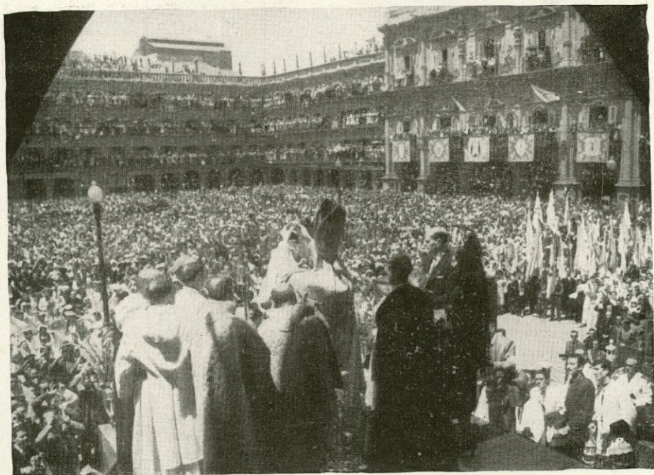
Momento de la Coronación de la Virgen de Peña de Francia

Otra efemérides inolvidable, organizada por el Rvdmo. Prelado, fue la de la Coronación de la Santísima Virgen de Peña de Francia. Una nueva y hermosa Pastoral convoca a los fieles diocesanos a tan solemne acto. El Sr. Obispo cursa las preces a Roma, que vienen concedidas favo-