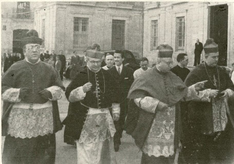
Excmo. Sr. Nuncio y Prelados asistentes a las Bodas de Oro de la Adoración Nocturna

Por la mañana, Misas de Comuniones generales, con millares de fieles, en la Catedral y en otras iglesias; por la tarde, los solemnes actos del quinario eucarístico con predicación sobre el Pan de los Angeles; durante el día ente-