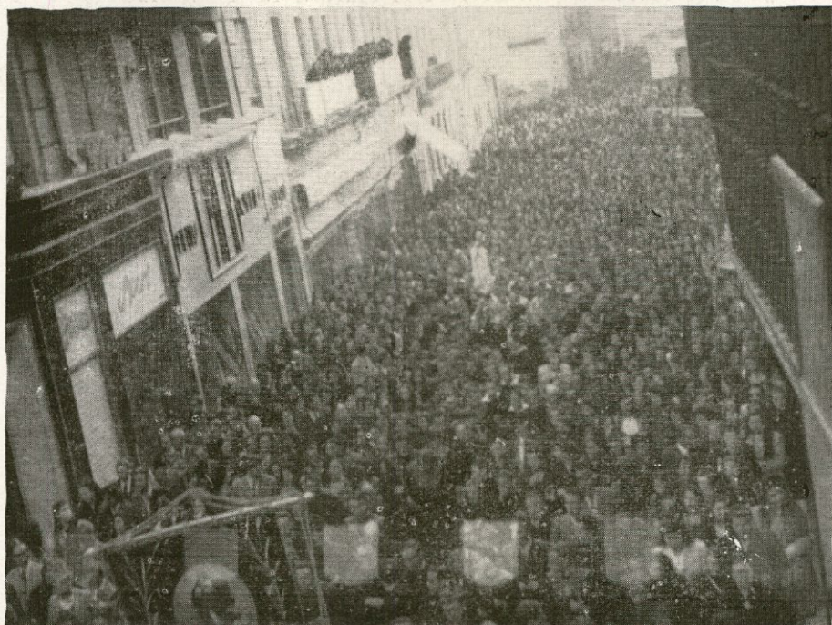
La Virgen Peregrina por las calles de Salamanca

De entusiasta desbordamiento popular podemos calificar la llegada a Salamanca de la Virgen Peregrina de Fátima, acaecida el día 25 de junio de 1947. Nuestro Sr. Obispo, devotísimo de la Virgen de Fátima, a cuyo Santuario ha peregrinado repetidas veces, volcó todo su corazón mariano en la preparación de tan santa visita. Todos recordamos la enorme manifestación de devoción popular en aquella memorable tarde. El Puente Nuevo, carretera de Madrid, Avenida del Puente, calles del trayecto albergaban una inmensa masa humana. El Sr. Obispo, con la emo-