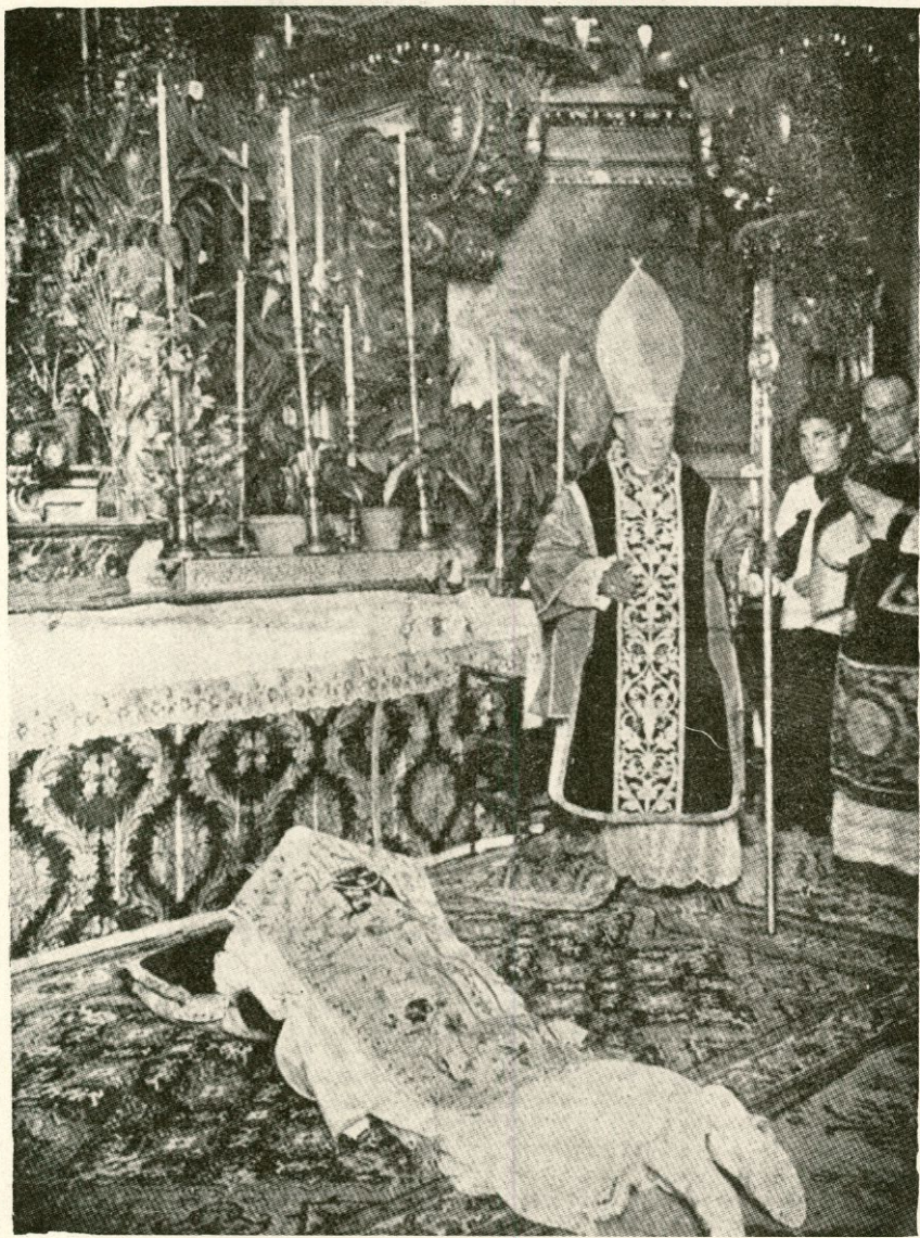
Uno de los momentos de la ceremonia litúrgica