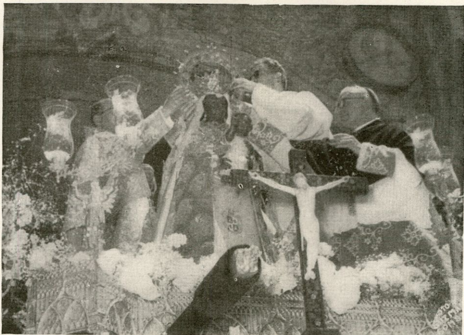
Momento de la Coronación de la Virgen

rablemente. El día 3 de junio de 1952 llega a nuestra ciudad el Eminentísimo Cardenal Tedeschini, para coronar a la Santísima Virgen de Peña de Francia. Ciudad y pueblos se agolpan en nuestras calles y plazas. De todas las comarcas, visitadas antes por la milagrosa imagen de la Virgen, llegan multitudes de peregrinos. En la mañana del día 4, un solemne Rosario de la Aurora, trasladando la imagen desde San Esteban a la Catedral, y desde ésta, en una impresionante procesión, es llevada a la Plaza Mayor. En un magnífico estrado toman asiento los Prelados, el Excmo. Sr. Ministro de Justicia y Autoridades salmantinas y nacionales. Se celebra una solemne Misa de Pontifical por el Sr. Obispo de la Diócesis, y acto seguido entre