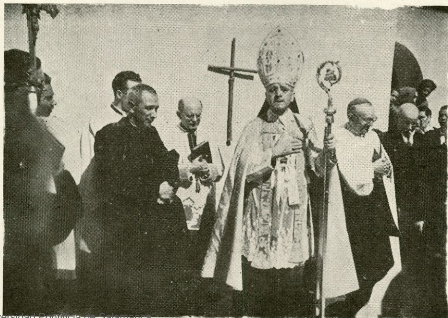
Bendición e inauguración por el Excmo. Sr. Nuncio del nuevo Seminario de Linares