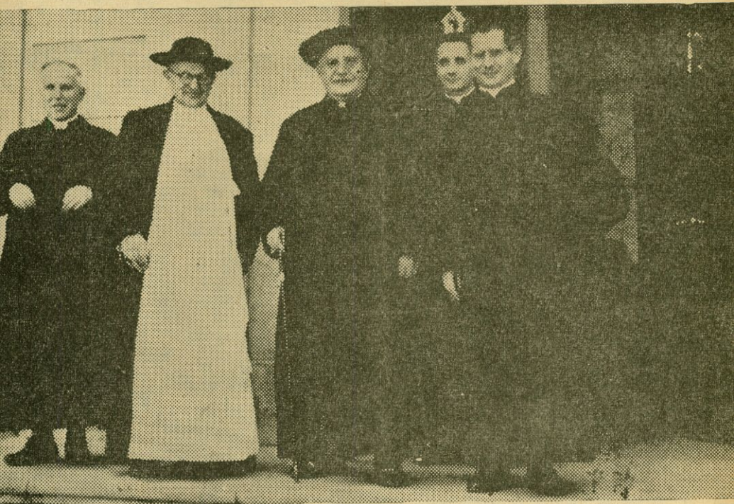
El Emmo. Cardenal Roncalli, hoy Juan XXIII, con el Rvdo. Prelado de la Diócesis durante su estancia en Salamanca el 25 de julio de 1954