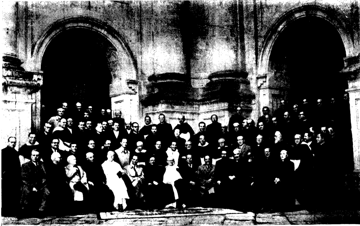
Grupo de profesores asistentes a la Semana Internacional de Estudios Eclesiásticos, presididos por las autoridades de Salamanca