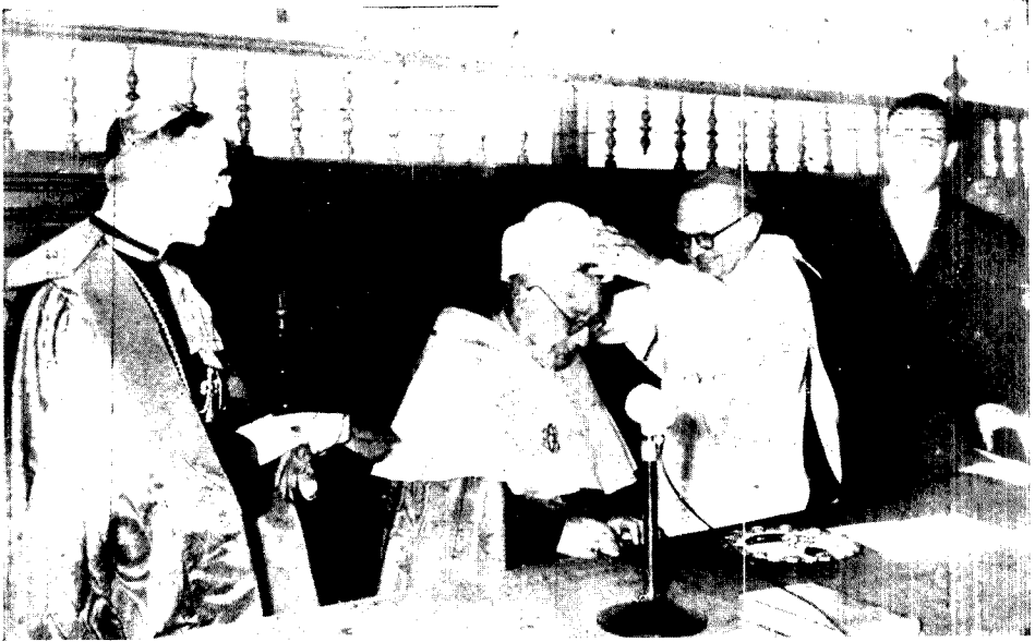
El Exemo. Sr. Gran Cancellor de la Pontificia Universidad Eclesiástica de Salamanca impone la birreta doctoral «honoris causa» en Teología al Eminentísimo Sr. Cardenal Primado Dr. Enrique Pla y Deniel