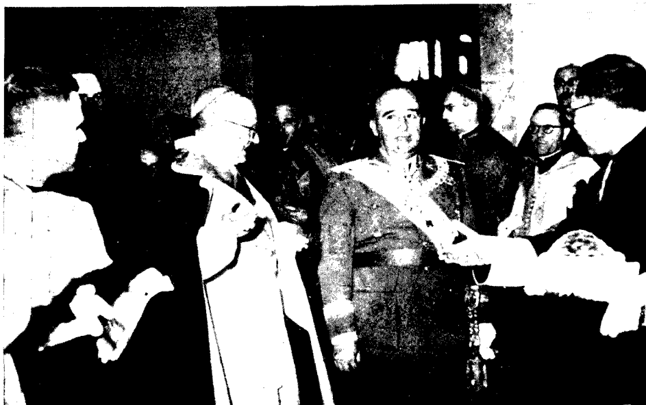
Su Excelencia el Generalísimo Francisco Franco ante la Sala Rectoral de la Pontificia Universidad Eclesiástica de Salamanca