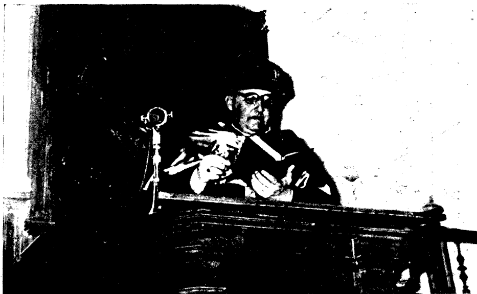
Desde la cátedra del Paraninfo de la Universidad Eclesiástica, Su Excelencia el Generalísimo, revestido de las insignias doctorales, lee, según rúbrica, el texto del Código Canónico