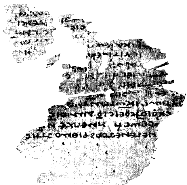
P. Barc. 3. Verso, 2 Par, 29, 32 - 35