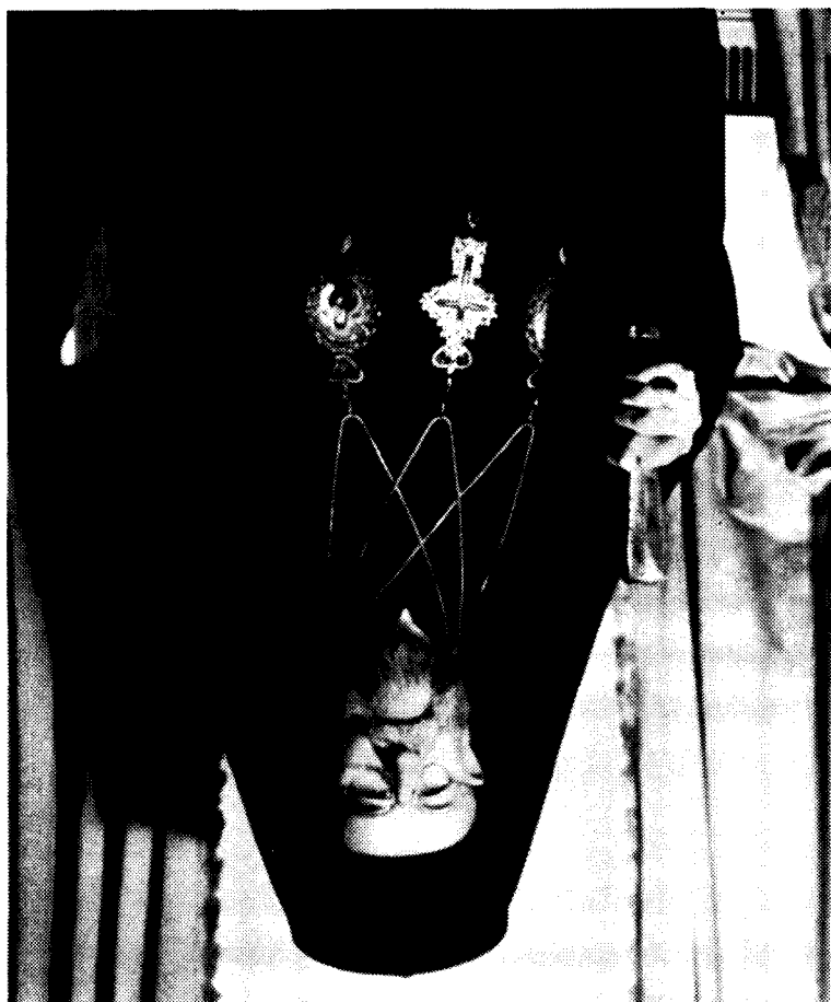
Su Beatitude Maximus IV, Patriarca Melquita de Antioquia y de todo el Oriente, de Jerusalén y de Alejandria.