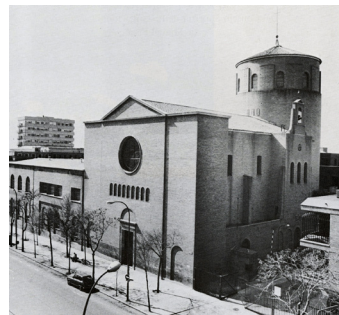
Fig. 3. Iglesia del Espíritu Santo.