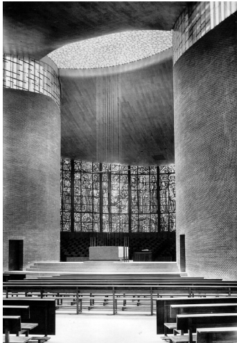
Fig. 4. Iglesia del Teologado dominico San Pedro Mártir de Alcobendas.