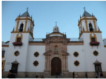
Fig. 2. Iglesia de Nuestra Señora del Socorro.