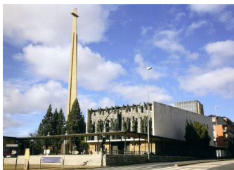
Fig. 5. Santuario de la Virgen del Camino.