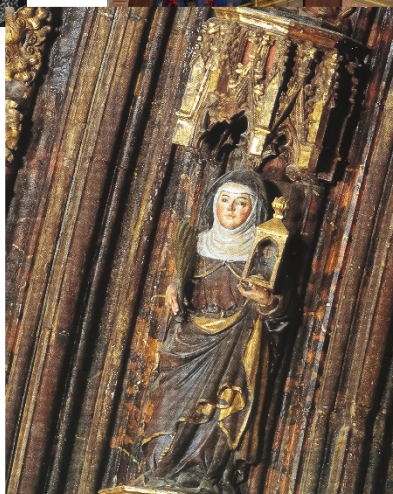
SALMANTICENSIS 69 (2022)