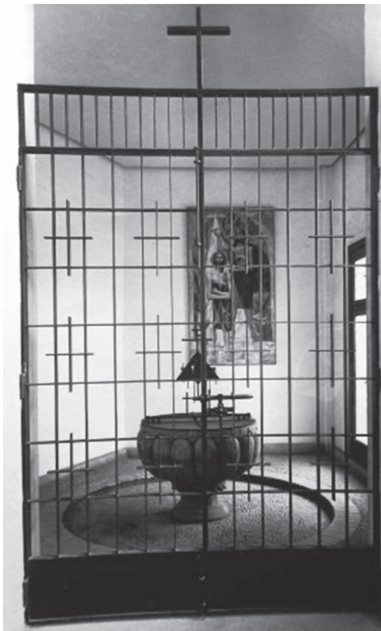
Fig. 4. Baptisterio en 1961. (AEA Z)