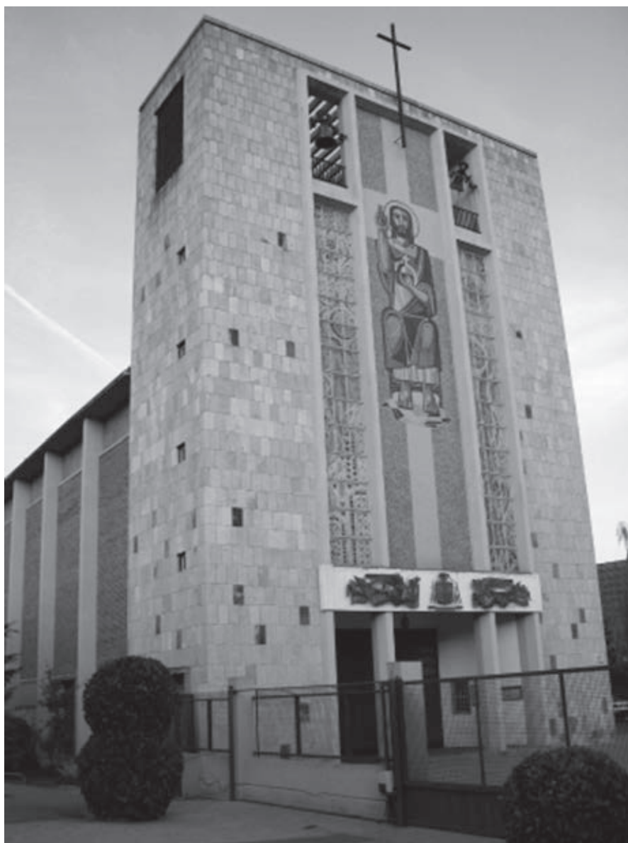
Fig. 5. Fachada principal