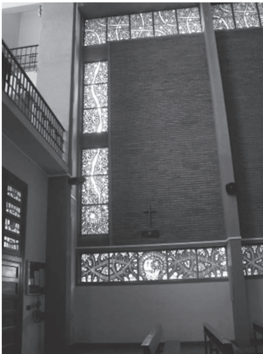
Fig. 7. Vidrieras de la nave