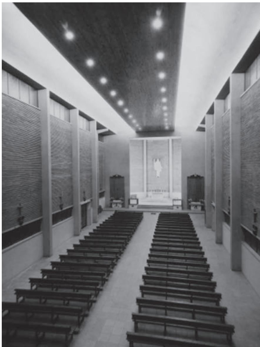
Fig. 2. Interior de la iglesia en 1961.