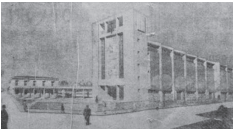
Fig. 6. Vista del primigenio conjunto parroquial. El Correo de Zamora , 31 de octubre de 1960, 6