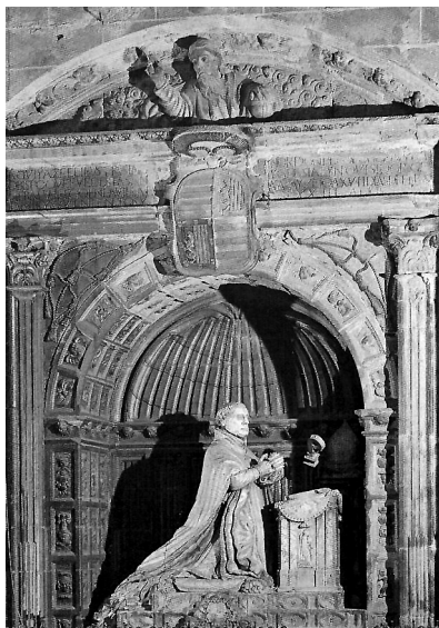
Sepulchro de Don Pedro Ponce de León.

Se encuentra en la Catedral de Plasencia en el presbiterio, al lado del Evangelio, cubierto por el dosel del trono pontifical, encuadrado en arco de medio punto entre dos pilastras de orden compuesto y entablamento en cuyo friso está grabado el primero de los epitafios y en el centro del mismo el escudo del prelado. Monumento sepulcral del obispo, atribuido a Pompeo Leoni por algunos, otros al artista granadino Mateo Sánchez de Villaviciosa (que probablemente realizó la obra arquitectónica), aunque la obra escultórica va más en consonancia con las características estilísticas de Francisco Giralte. Se encuentra el obispo de rodillas en un reclinatorio orando con las manos juntas y revestido de casu-