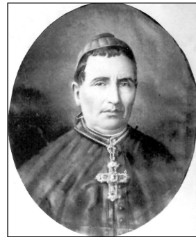
D. Pedro Casas y Souto

D. U. T. EL DOCTOR DON PEDRO CASAS Y SOUTO NATURAL DE SOBRADOS (ORENSE) OBISPO DE ESTA DIÓCESIS FALLECIO SANTAMENTE EN SU CASA PALACIO A LAS 8 Y 10 MINUTOS DE LA NOCHE DEL 25 DE JULIO DE 1906, CONTANDO 79 AÑOS 9 MESES Y 11 DIAS DE EDAD. Y DESPUÉS DE 30 AÑOS Y 5 MESES DE UN PONTIFICADO EN QUE CON EL EJEMPLO Y LA PALABRA FUE MODELO DE PASTORES PADRE D ELOS POBRES Y MARTILLO DEL LIBERALISMO SIENDO POR ELLO ADMIRADO DE PROPIOS Y EXTRAÑOS Y TEMIDO DE LOS QUE ANDAN EN LAS TINIEBLAS Y EN LA SOMBRA DE LA MUERTE SE SIENTAN. DESDE EL CIELO VELA POR SU AMADA GREY PLACENTINA Y POR EL TRIUNFO DE LA FE CATOLICA R.I.P.