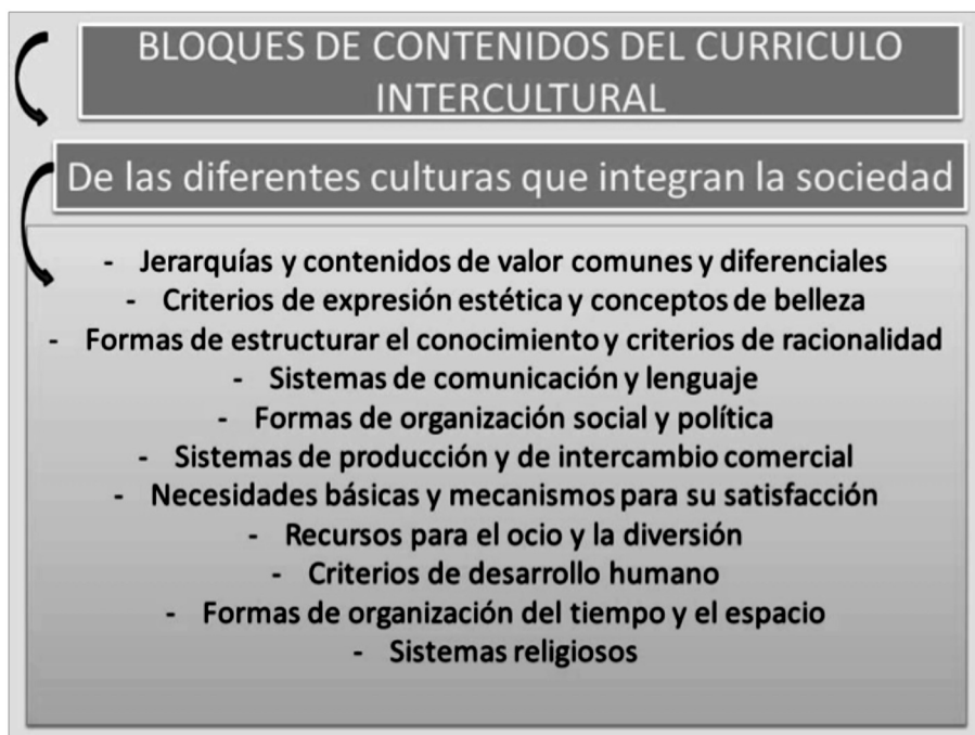
FIGURA 5: Bloques de contenidos del currículo intercultural a partir de Medina y Salvador (2002, p. 413).

de expresión y conceptos de belleza, las formas de estructurar el conocimiento, los criterios de racionalidad, los sistemas de comunicación y lenguajes, las formas de organización social y política, las necesidades básicas, los recursos para el ocio, los sistemas religiosos, las formas de organización del tiempo y el espacio, etc.