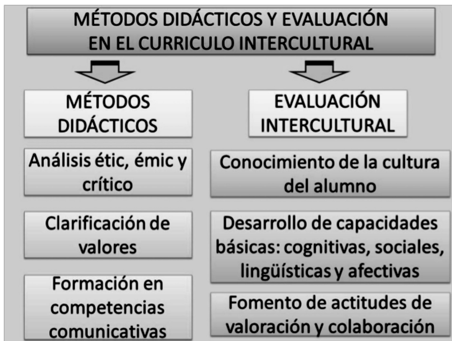
FIGURA 6: Métodos didácticos y evaluación en el currículo intercultural a partir de Medina y Salvador (2002, p. 413).

Esta nueva metodología lleva consigo la aplicación de estrategias interculturales innovadoras y creativas que según Besalú (2002) y González y Gómez (2002) se pueden clasificar como de intervención educativa, sociales, pedagógicas, organizativas y de agrupamiento, de enseñanza, de interrelación y didácticas.