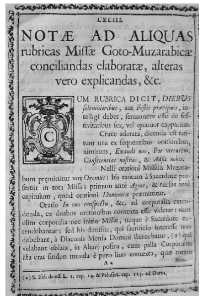
39. RG, p. LXLIII