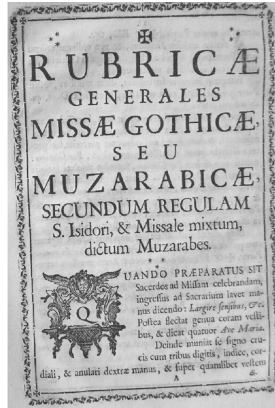
28. RG, p. I