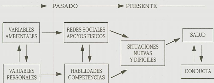
Figura 1: Influencias ambientales, sociales y personales en la salud y en la conducta. (Adaptación de Moos y Mitchell, 1982).

Ciertamente, es imposible por nuestra parte, controlar determinados eventos provocadores de estrés que ocurren cuando se avanza en el ciclo vital. Por ejemplo, no podemos evitar que un anciano no pierda a sus seres queridos, o que no se jubile si la legislación así lo determina.