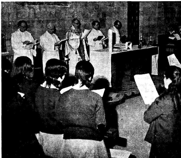
Liturgia luterana, presidida por el Obispo luterano Silen

El luteranismo mundial estaba representado por unos 20 profesores convocados por el Centro Luterano de Estrasburgo. El catolicismo español había enviado unos 40 participantes convocados por el Centro Ecuménico Juan XXIII de Salamanca. Entre los católicos destacaba el equipo de profesores espe-