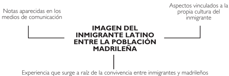
Gráfico 2. Aspectos que construyen la imagen del Inmigrante Latino entre la población madrileña.

Es interesante observar cómo cuando el inmigrante proyecta su propia imagen sobre el madrileño, en realidad nos está hablando de sí mismo, de su propio yo.