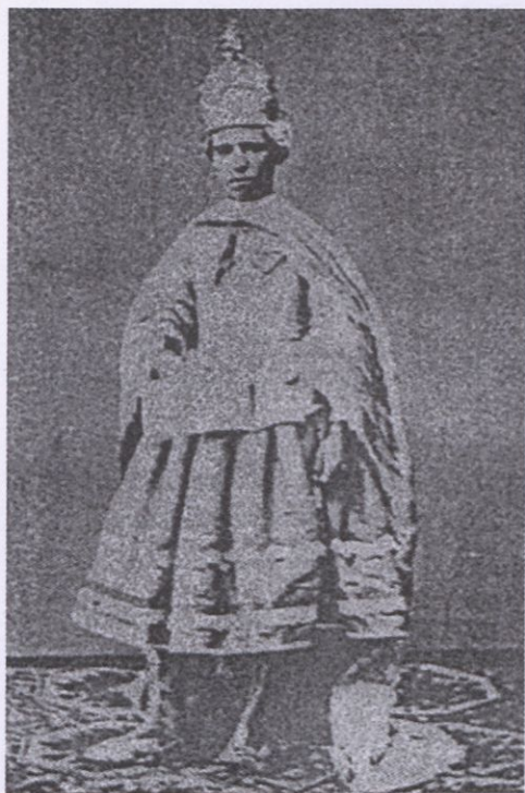
Clerizón o acólito acompañante de la Sibila.