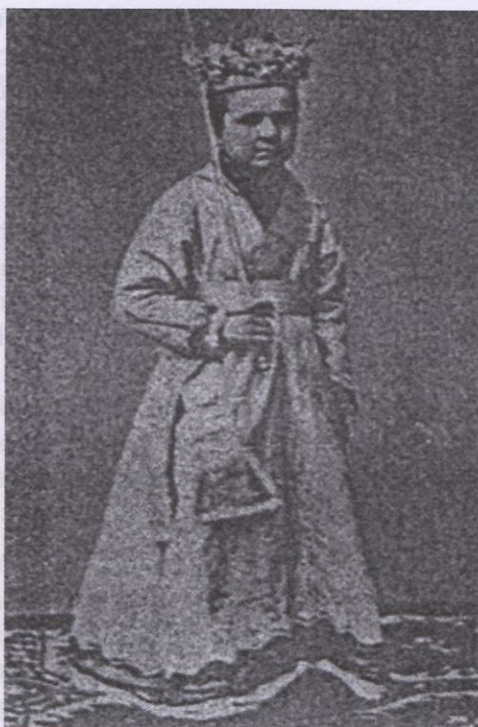
Seise con el traje de la Danza y Canto de la Sibila.

mano, se situó sobre un tablado pequeño, expresamente colocado para este acto entre los dos coros, arrimado a la reja del coro Mayor por la parte de afuera, junto al púlpito del Evangelio.