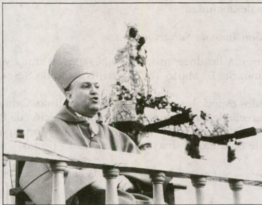
El Obispo de Salamanca, D. Mauro Rubio Repullés, pronunciando la Homilía en la concentración religiosa en el antiguo campo de fútbol salmantino «El Calvario», ante 20.000 diocesanos

Para la gran concentración de la Diócesis de Salamanca, el Excmo. Sr. Obispo señaló el día de Pentecostés, 29 de mayo. La vigilia de oración se celebró en la iglesia de San Esteban. Multitud de fieles, junto a la imagen de Nuestra Señora de la Peña, permanecieron en oración, como los apósto-