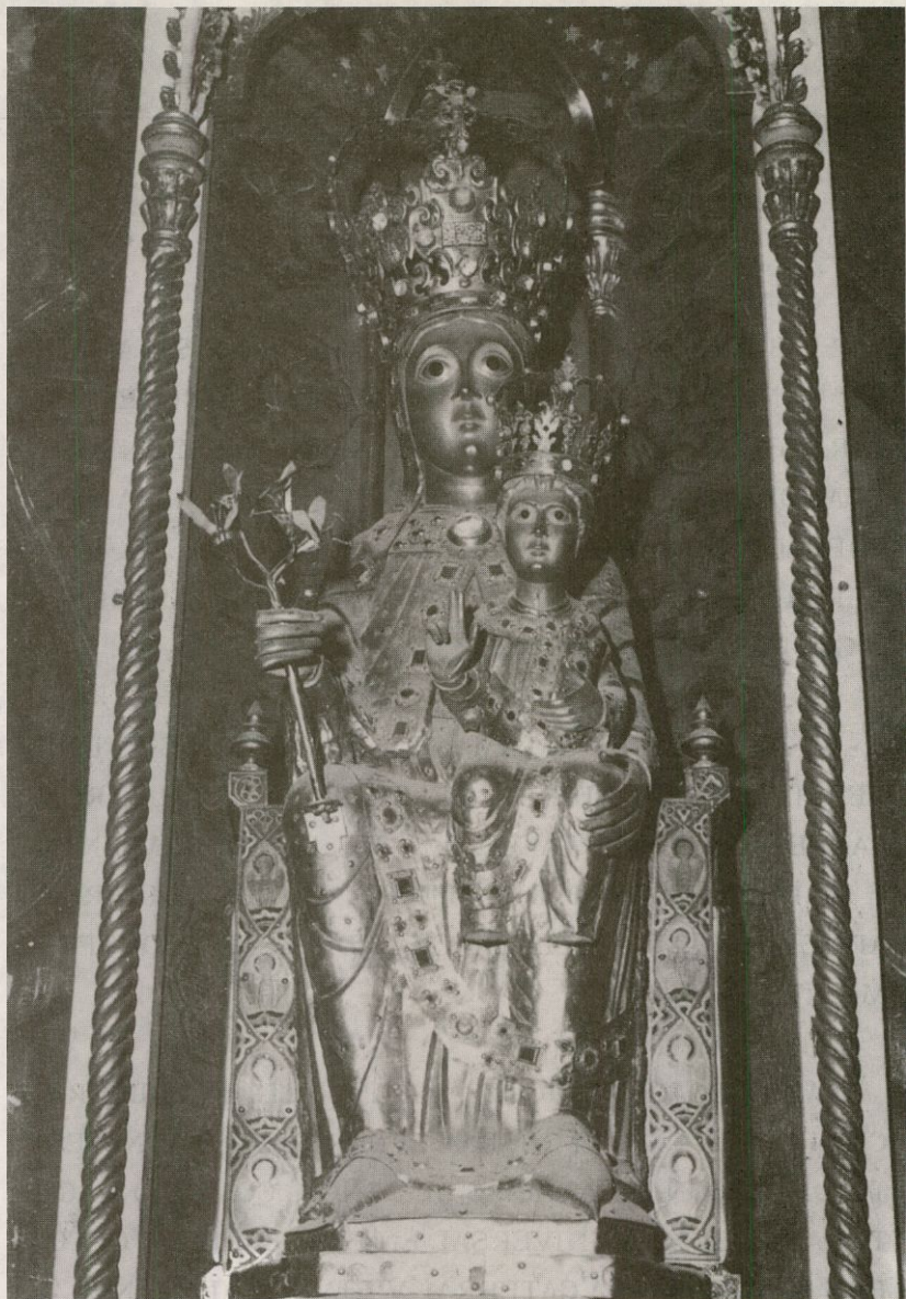
Ntra. Sra. de la Vega Patrona de Salamanca y su Tierra

La devoción a la Santísima Virgen María, Madre de Dios, tan profundamente arraigada en España desde los tiempos apostólicos, fue transplantada íntegramente al continente americano desde el primer momento de la conquista por los descubridores y los misioneros franciscanos y fue sin duda el más preciado legado que España dio a América, después de la fe en el Salvador, Nuestro Señor Jesucristo.