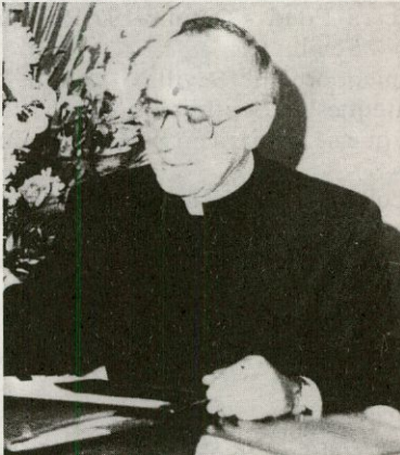
Excmo. y Rvdmo. Señor Don Ciriaco Benavente Mateos, nuevo obispo de la diócesis de Coria-Cáceres

Don Ciriaco Benavente Mateos nació el 3 de enero de 1943 en Malpartida de Plasencia (Cáceres). Fue ordenado sacerdote en Plasencia el 4 de julio de 1966.