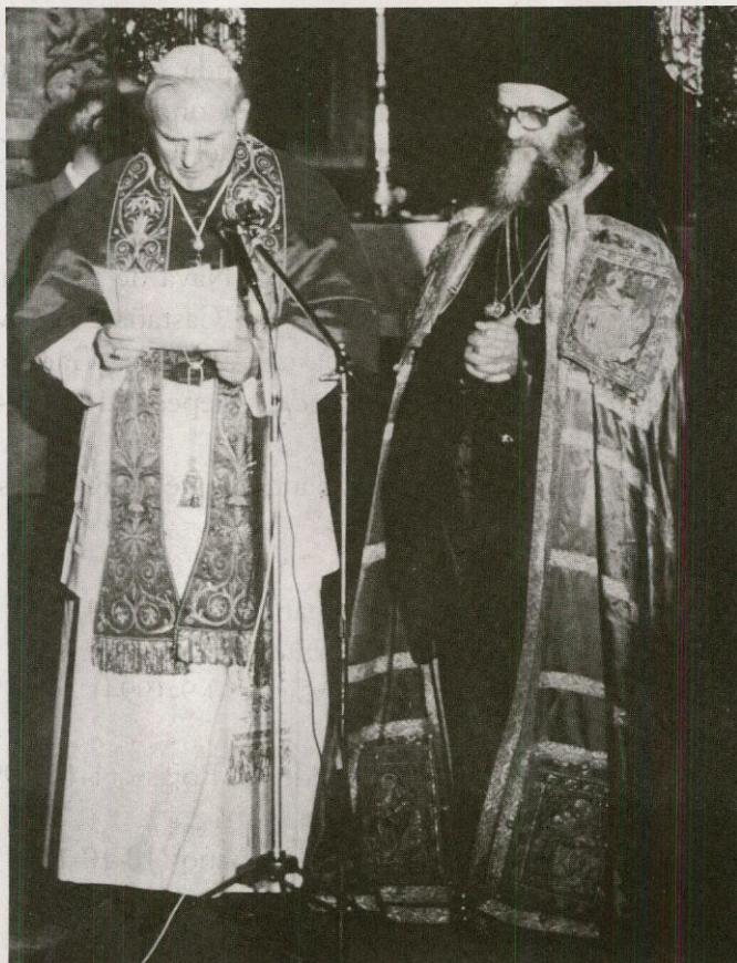
Juan Pablo II con el Patriarca Dimitros I