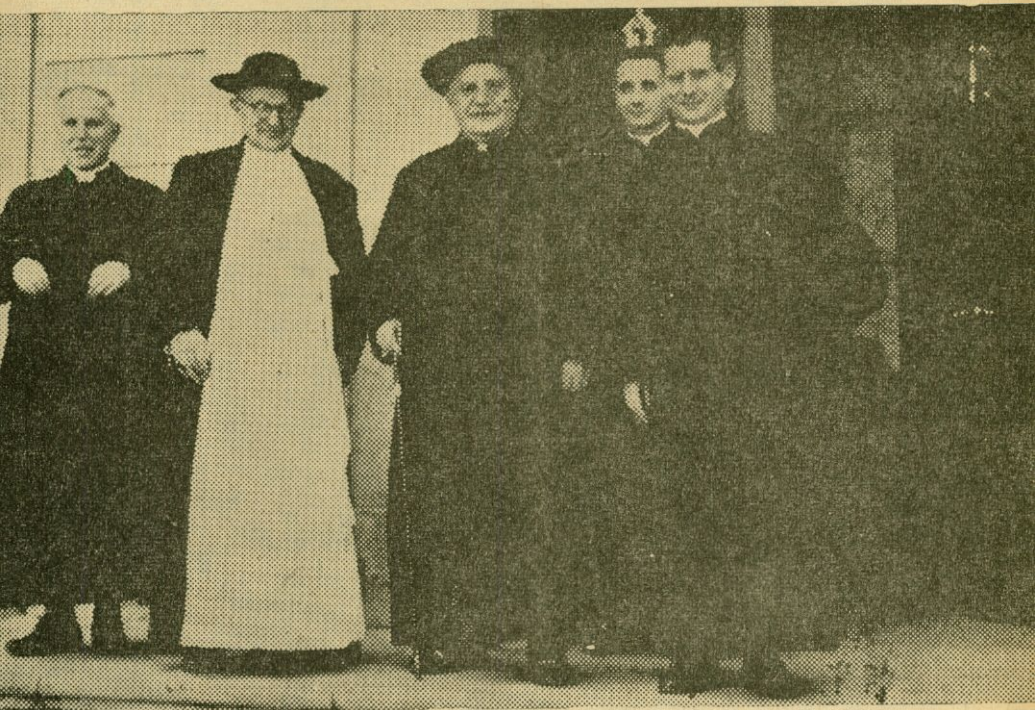
El Emmo. Cardenal Roncalli, hoy Juan XXIII, con el Rvdmo. Prelado de la Diócesis durante su estancia en Salamanca el 25 de julio de 1954