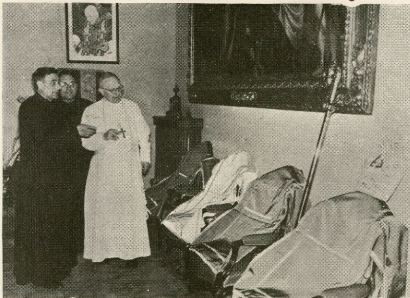
Obsequios ofrecidos al Excmo. Sr. Obispo

de los siguientes objetos adquiridos por el Clero y fieles de la Diócesis: un báculo confeccionado por «Talleres de Arte Granda», una mitra preciosa y un juego de tunicelas de los distintos colores litúrgicos. El Prelado, visiblemente emocionado, aceptó dichos obsequios, manifestando en breves y sencillas frases su agradecimiento y su voluntad de estrenar dichos objetos litúrgicos en el solemne Pontifical del siguiente día.