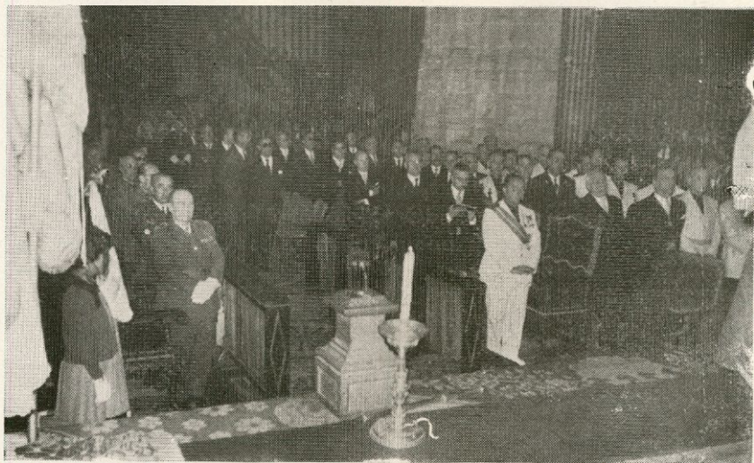
Todas las Autoridades de Salamanca asistieron a la Misa Pontifical