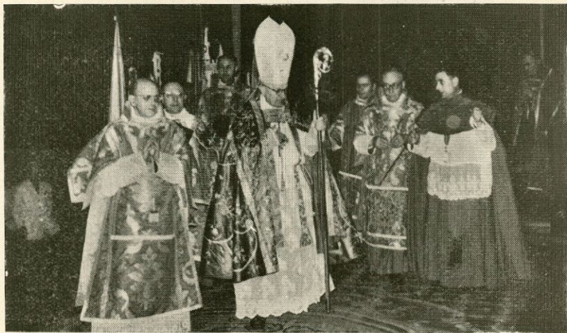
Un momento del solemne Pontifical

A las doce de la mañana del día 29, celebró el Prelado una solemne Misa Pontifical en la Santa Iglesia Basílica Catedral.