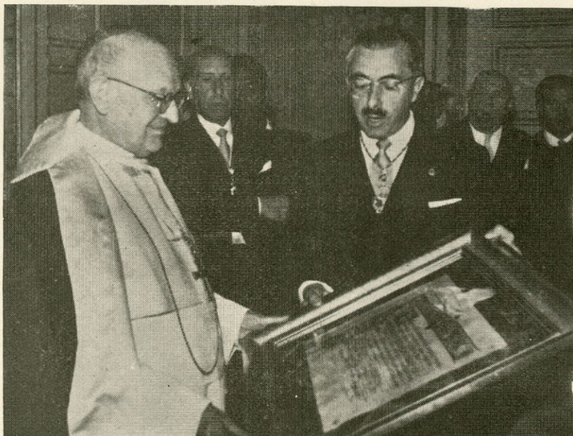
El Sr. Alcalde de Salamanca entrega al Rvdmo. Prelado el Título de Hijo Adoptivo e Ilustre de la Ciudad