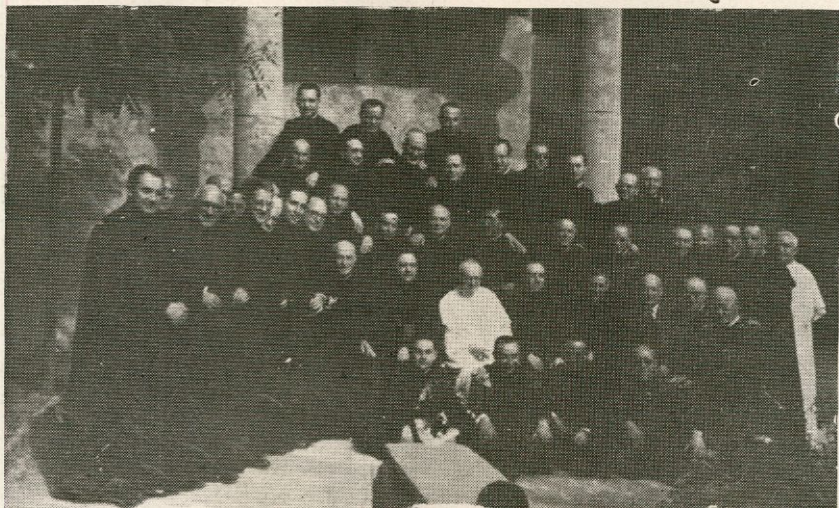
El Rv. lmo. Prelado rodeado de los sacerdotes, asistentes a la comida en la Casa Sacerdotal

Finalmente, el Sr. Obispo dirigió a todos unas palabras de agradecimiento.