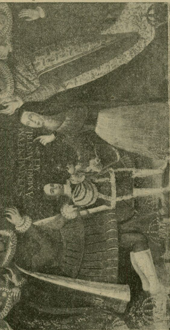
Cuadro que se conserva en este Seminario Pontificio.