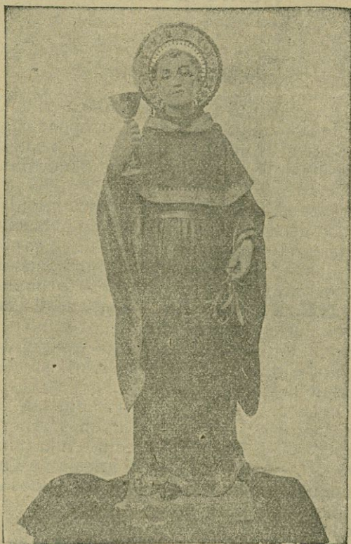
San Juan de Sahagún, Patrono de Salamanca y muy amante de Jesús Sacramentado.