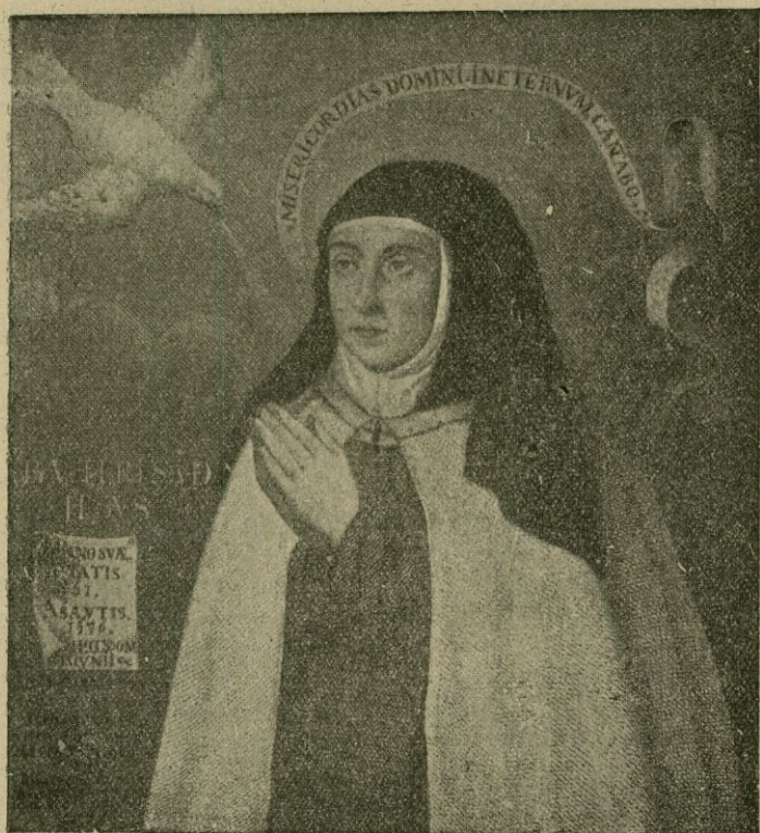
Santa Teresa de Jesús, Patrona de esta diócesis y devotísima del Santísimo Sacramento.