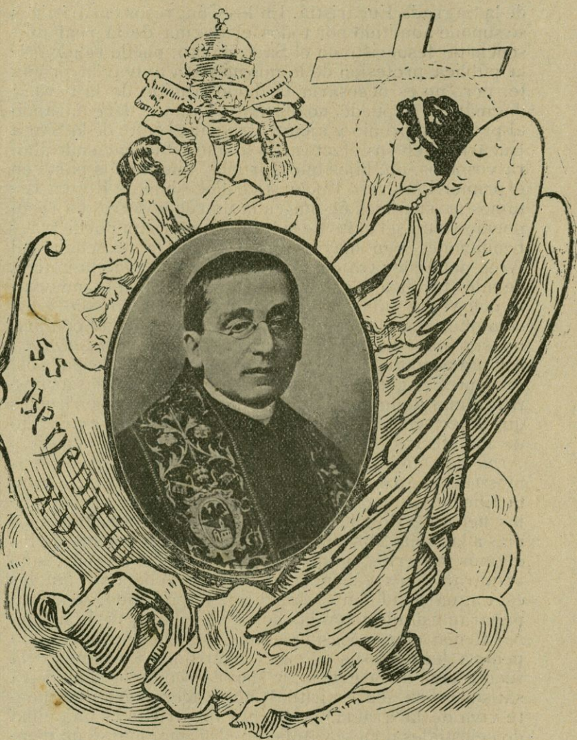
Su Santidad el Papa Benedicto XV.