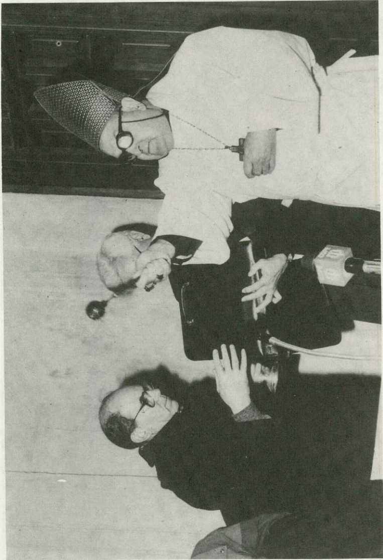
El Sr. Obispo bendice la «Casa Diocesana de la Iglesia»