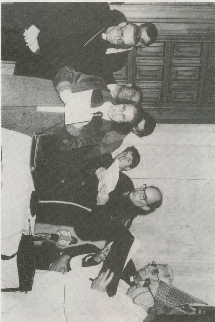
Una religiosa salmantina da lectura a un pasaje del Nuevo Testamento (Foto España)