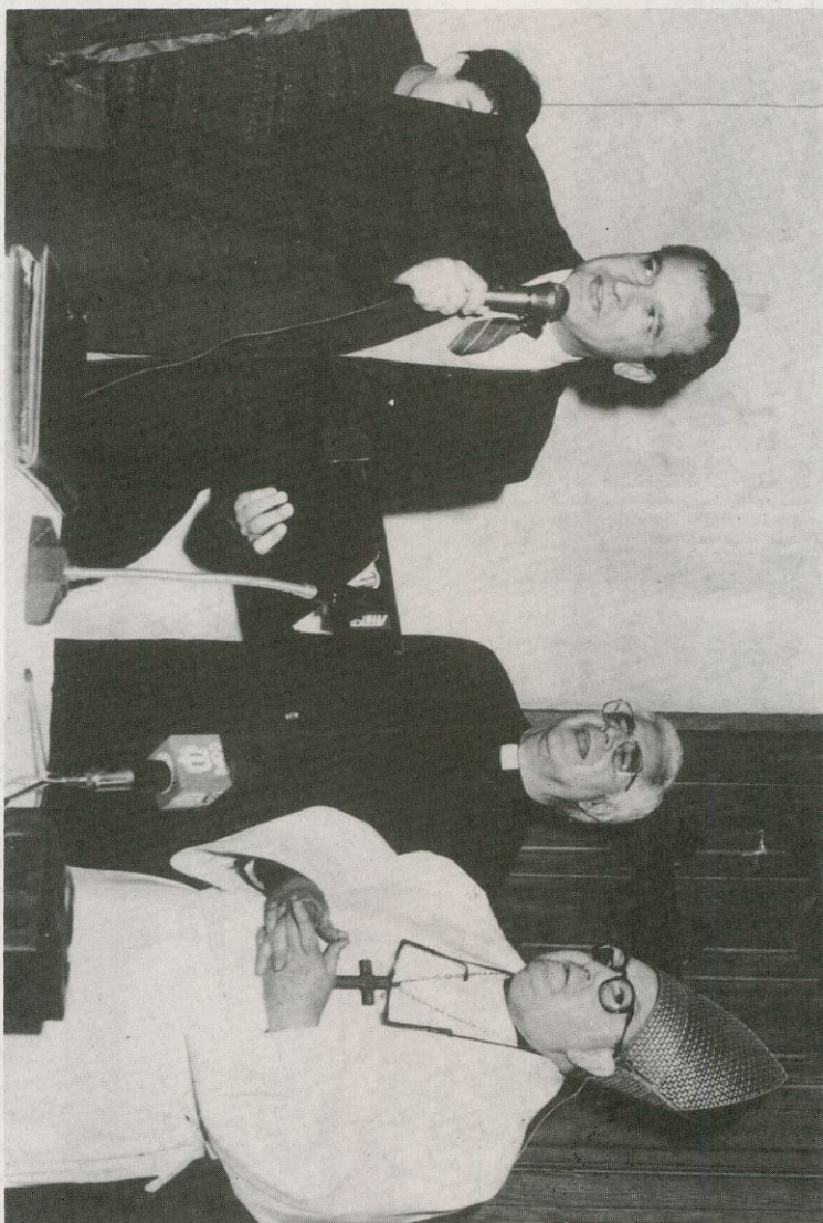
El Rector de Seminario Diocesano de Salamanca en la alocución que tuvo al final de la inauguración de la «Casa Diocesana de la Iglesia»