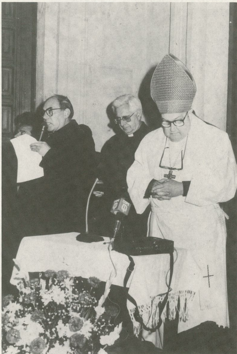
Canto final: «Anunciaremos tu Reino Señor»