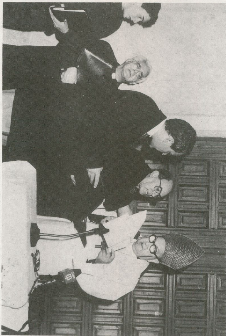
Palabras finales de Sr. Obispo