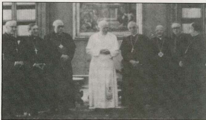
Monseñor Estepa, segundo a la izquierda del Papa, uno de los siete redactores

«El nuevo catecismo, punto de referencia para la catequesis de las comunidades cristianas esparcidas por el mundo, ofrecerá en este sentido un marco seguro. Recemos a la Virgen Santa para que suscite en toda la Iglesia un nuevo ímpetu en la tarea de difundir el gozoso mensaje de la salvación».