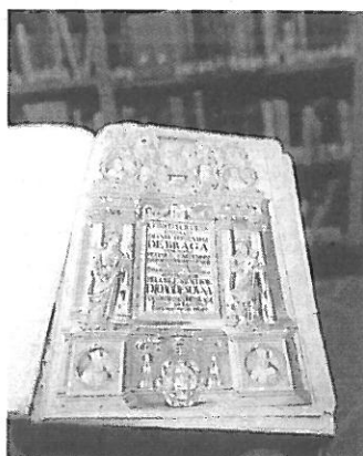
Un ejemplar de la colección