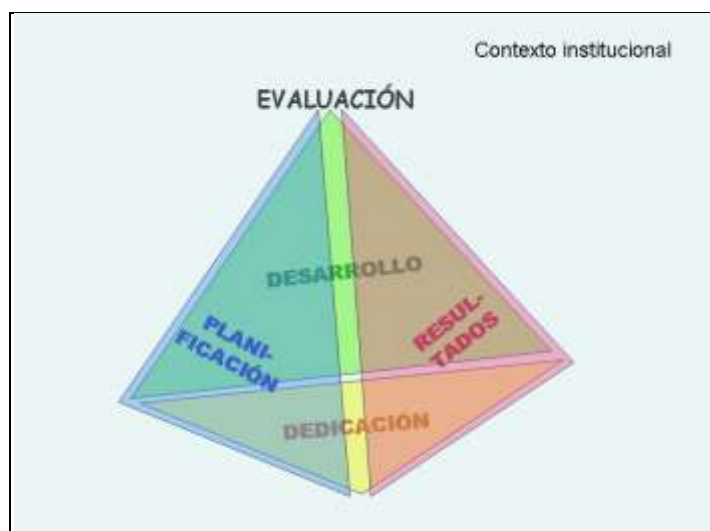
Figura1. Dimensiones de evaluación de la actividad docente 8

“El Programa de Apoyo a la Evaluación de la Actividad Docente del profesorado universitario toma como base un modelo que considera las actuaciones que realiza el profesor fuera y dentro del aula, los resultados que de ellas se derivan, así como su posterior revisión y mejora en términos de formación e innovación docentes” 7 .