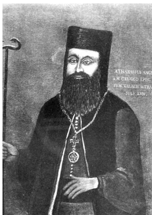
Lienzo-retrato de Atanasio Anghel

La idea de la Unión fue reanudada, puesta en marcha y fuertemente impulsada por su sucesor, Atanasio Anghel 12 (1697-1713), que, habiendo sido educado en el ambiente calvinista, pasaba por ser una persona segura desde el punto de vista de las «Naciones», que lo habían propuesto. Comparándolo con Teófilo, su camino hacia la unión de las Iglesias fue facilitado por una serie de nuevas reglas emanadas del emperador austriaco y de la Iglesia católica de Hungría.