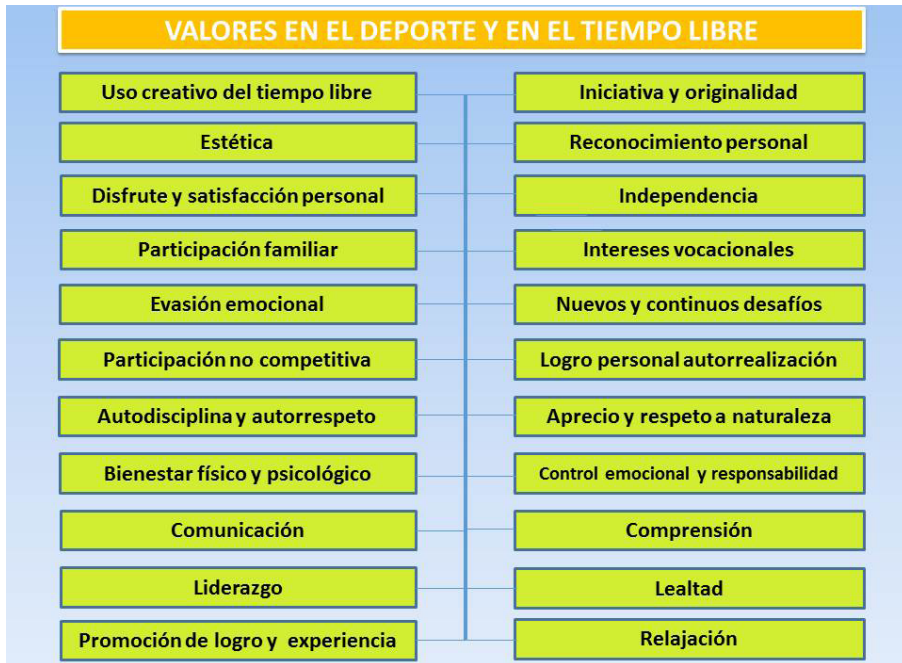
Figura 2: Valores del deporte recreativo y del tiempo libre

Fuente: Frost y Sims (1974) en Ruíz y Cabrera (2004)