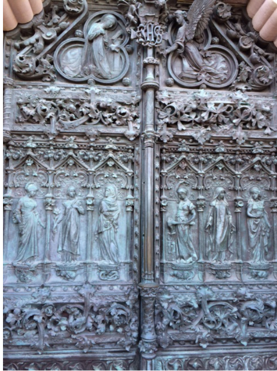
Figura 4: Puerta de las Virtudes en la entrada principal de la Universidad Pontificia de Comillas

Vivir los valores en el deporte, y entre ellos la paz y su cultura, implica y significa vivir la prudencia, la justicia, la templanza, la empatía, el ser benevolentes, mostrar buena voluntad, etc.