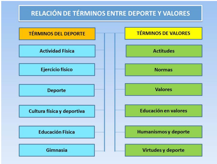
Figura 1: Términos relacionados entre deporte y valores. Elaboración propia

Por ejemplo, la actividad física es el movimiento del cuerpo humano originado por la musculatura esquelética, que produce un consumo de energía superior al ocasionado por el metabolismo basal (Corbin y cols., 2005). Por otro lado, el ejercicio físico es el movimiento del cuerpo humano organizado y programado para conservar o perfeccionar elementos del fitness , conocido a partir de 2014 como deporte que produce muchos beneficios a las personas que andando rápido y trabajando aeróbicamente el cuerpo, no tienen las exigencias que produce el running . (U.S. Department of Health and Human Services, 1996).