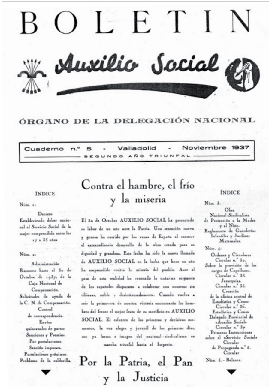
Ilustración I. Portada del Boletín Auxilio Social . Cuaderno n.º 5