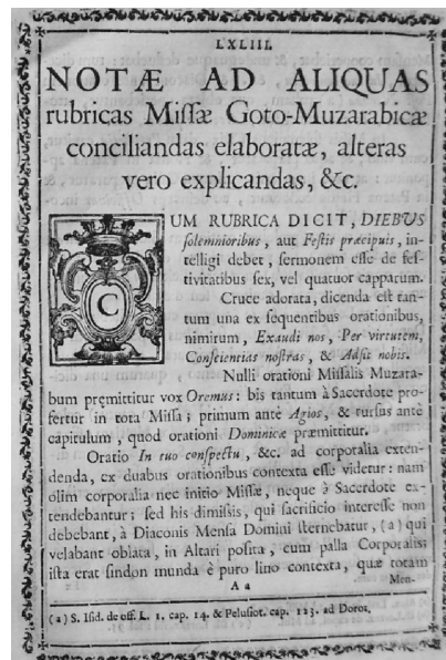
39. RG, p. LXLIII