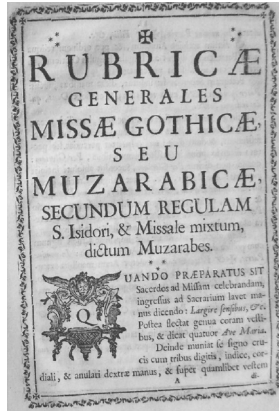
28. RG, p. I