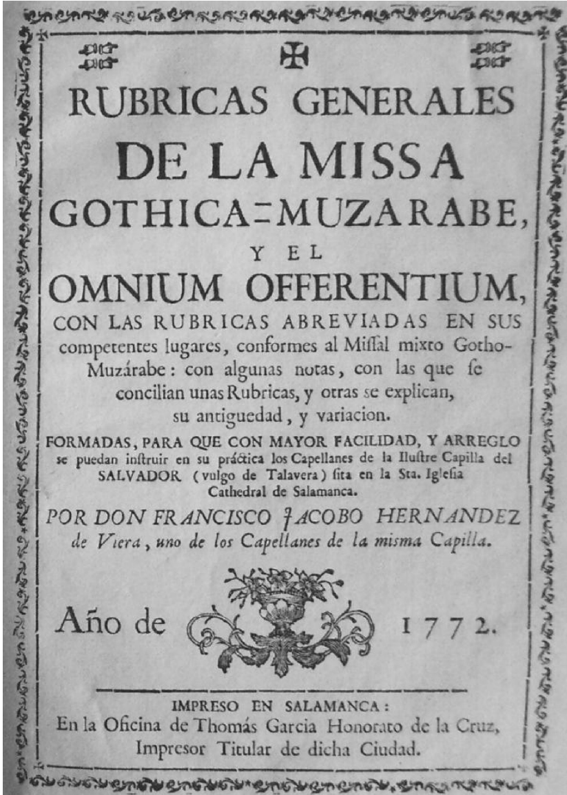
19. RG, f. 1r